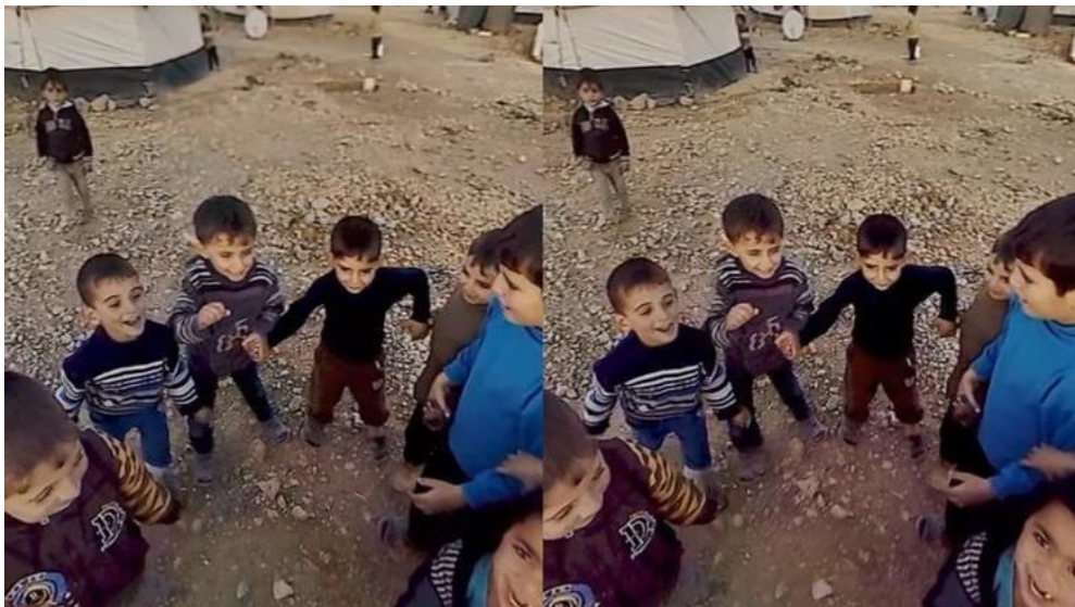
Clouds Over Sidra