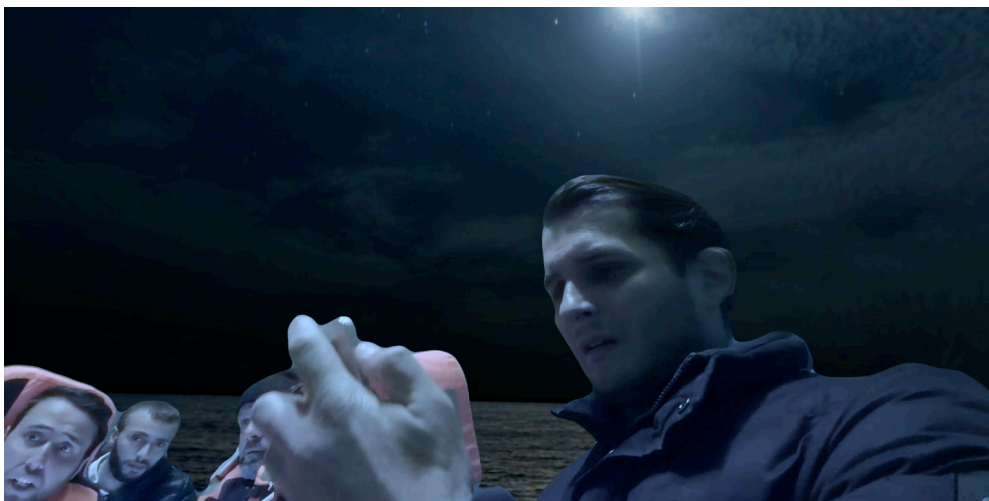
The Crossing - 2022, Neil Bell