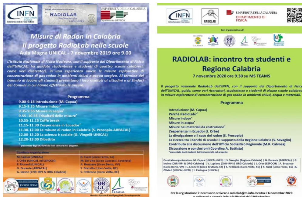
Fig. 5. – Poster del Workshop di fine primo ciclo (2019) a sinistra e dell'ultimo Radon Day (2020) a destra.