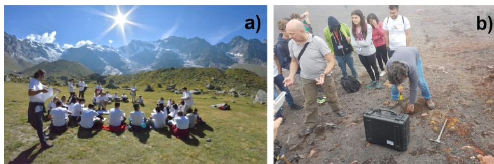
Fig. 6. – a) Lezione all'aperto a 2050 m slm sulla geologia della zona del Monte Rosa (scuola estiva 2018); b) misure in campo di esalazione di gas radon dal suolo sull'Etna (scuola 2019).

È importante sottolineare come questi momenti di incontro, oltre a rappresentare un momento di studio, di confronto dei risultati ottenuti e di condivisione delle esperienze realizzate nelle diverse realtà presenti nel progetto, sia a livello locale che nazionale, rappresentano anche e soprattutto un importante momento di socializzazione, che restituisce a studenti e insegnanti il senso profondo dell'attività scientifica e dell'attività di laboratorio in particolare.