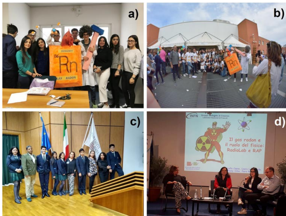
Fig. 4. – a) Preparazione di una scena per attirare verso interviste gli/le ospiti della ERN UNICAL 2018 (è visibile il cattivo radon e la scienziata o scienziato buono che protegge le persone); b) un momento dello stesso evento; c) la delegazione ecuadoriana al Workshop 2019; d) un incontro pubblico organizzato al FdS di Vibo Valentia nel 2018.

Curie l'organizzazione di numerosi eventi legati ai diversi temi d'interesse del progetto come l'European Radon Day. In particolare, alla fine del primo ciclo calabrese del progetto (2019), è stato realizzato il 7 novembre un Workshop di chiusura del primo triennio interamente gestito dagli studenti e le studentesse calabresi ed ecuadoriani (dalla scelta di relatori e relatrici, report fotografici, segreteria ecc., perfino i coffe break sono stati gestiti da un istituto alberghiero di Cosenza). All'evento sono stati invitati, oltre alle scuole, esperti dell'ARPACal, i geologi con cui si sono confrontati durante il triennio, Sindaci e Assessori dei territori in cui hanno effettuato le misurazioni per un totale di circa 600 persone. La fig. 5 mostra il poster del Workshop 2019 e l'ultimo Radon Day organizzato in modalità remota il 7 novembre 2020, in cui gli studenti hanno deciso di raccontare alla loro Regione il progetto e la sua importante finalità. L'evento ha visto la partecipazione di 300 studenti italiani ed ecuadoriani, l'assessore regionale Prof.ssa S. Savaglio, esperti dell'ARPACal e dell'ordine dei geologi.