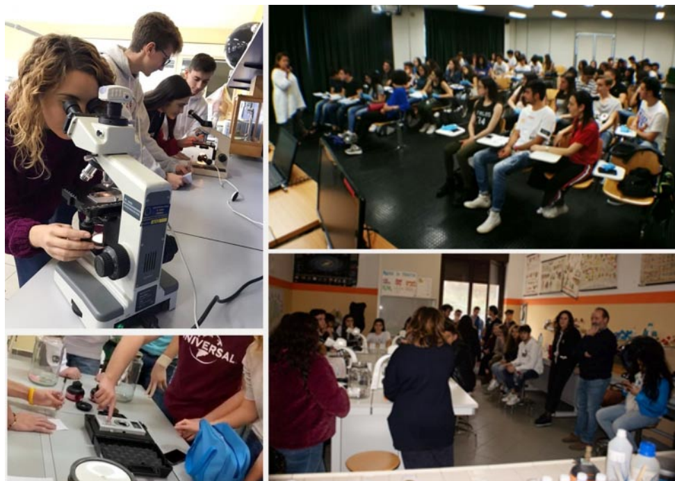
Fig. 3. – Alcune attività didattiche e sperimentali del progetto presso l'UNICAL e nei laboratori delle scuole.