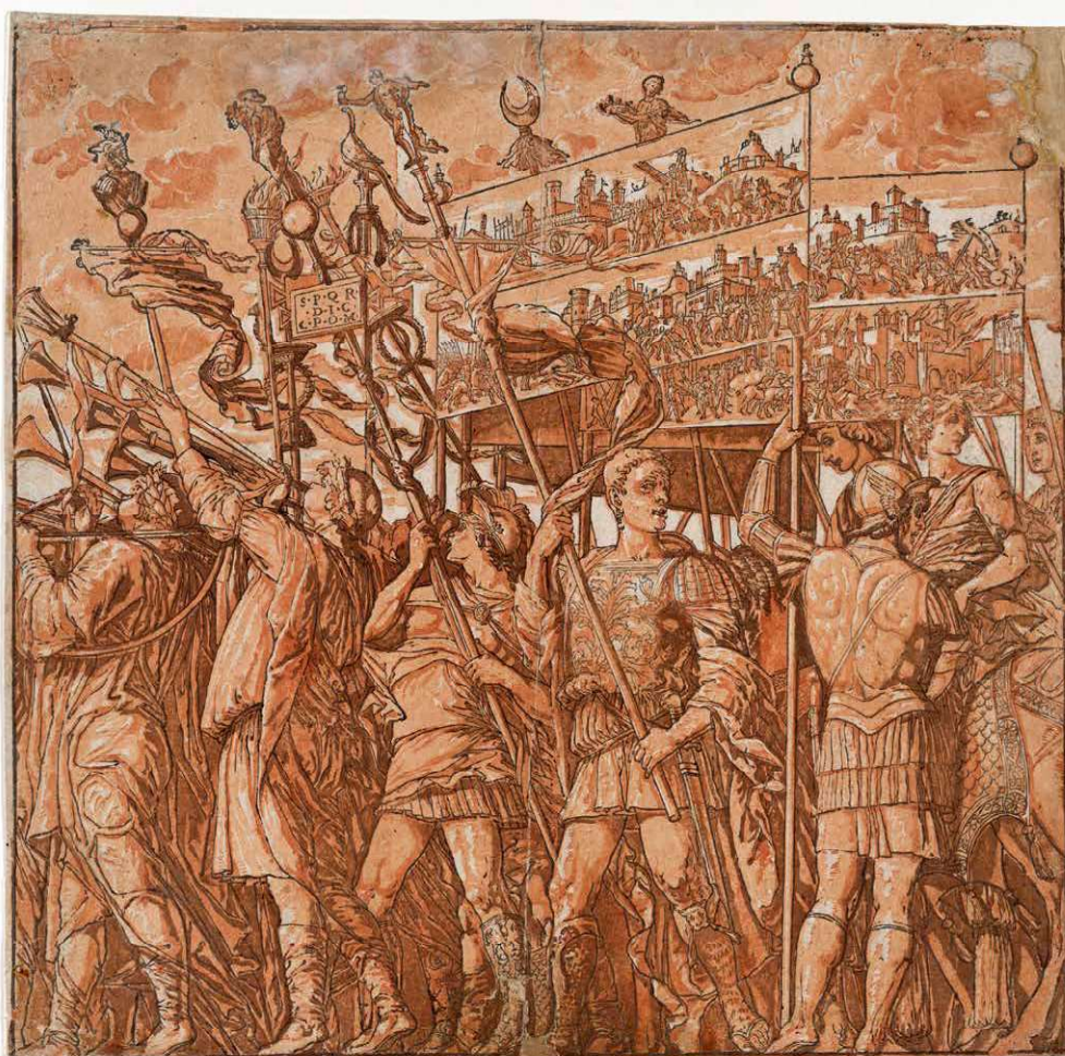
Andrea Andreani, una delle tavole del Trionfo di Giulio Cesare (1599), xilografia dal dipinto di Andrea Mantegna per la Corte dei Gonzaga di Mantova. Dal 1932 al Metropolitan Museum of Arts.

enicos faciet, colonos Genetivos incolasque hospitesque atventoresque ita sessum ducito, ita locum dato distribuito atsignato ). Dovremmo dunque pensare che gli incolae del capitolo 103, perché contributi , rappresentassero qualcosa di diverso, dal punto di vista giuridico, rispetto agli altri incolae , e che forse proprio in questa loro specificità risiedesse l'obbligo, per loro (e solo per loro, rispetto ai "normali" incolae ), di difendere la colonia 30 . Alcuni hanno ritenuto, ad esempio,