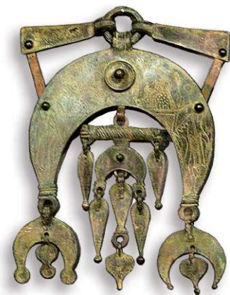
Museo Carnuntinum (Bassa Austria). Pettorale come parte dell'equipaggiamento per cavalli (I secolo) del Reno Settentrionale (?), ritrovamento fluviale.