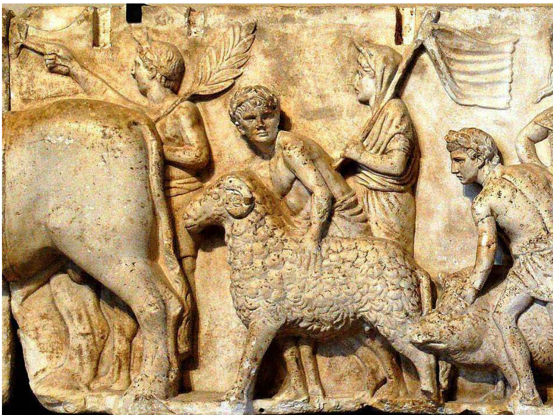
Scena di un sacrificio durante un census, con milites armati con elmi del tipo di Montefortino con pennacchio di crine di cavallo, cotta di maglia con spallacci, scudi ovali con coperture in pelle di vitello, gladio e pilum . Particolare dall'Altare di Domizio Enobarbo nel Campo Marzio (122 a. C.). Dal 1824 al Louvre (Département des Antiquités grecques, étrusques et romaines, Denon, rez-de-chaussée, salle 22).

Baetica o del conventus Astigitanus , posti sotto la giurisdizione di Urso, ma, contemporaneamente slegati da questa, la loro assenza presso i ludi locali potrebbe apparire più accettabile; senza dubbio più accettabile rispetto alla possibilità che vi fossero degli incolae , solitamente ben integrati nelle compagnie civiche di appartenenza, che non potevano prendere parte agli spettacoli della colonia. In effetti, la ricostruzione di Laffi permetterebbe di capire perché al capitolo 126 non è fatto cenno ai contributi : possiamo pensare che i ludi fossero rivolti in prima istanza ai coloni e agli incolae della città, mentre tutti gli altri (inclusi i contributi ,