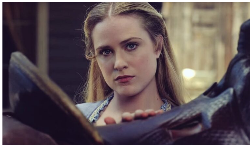
Westworld – Dove tutto è concesso (Nolan, Joy, 2016 – in corso)

Persona. Soggettività nel linguaggio e semiotica dell'enunciazione di Claudio Paolucci.