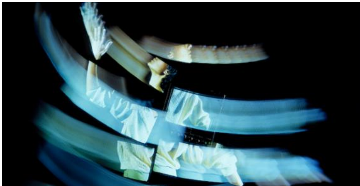
La camera astratta (Studio azzurro, 1987)

perno di una ipotetica iper-soggettiva, semplicemente non ci sia. Piuttosto, sostiene Paolucci, quello che si dà è un assemblaggio di diverse istanze enuncianti, plurali e non necessariamente personali, spesso anzi macchiniche, il cui effetto principale è quello di dotare lo spettatore o utente di protesi che offrono inediti «punti di prensione percettiva, cognitiva e narrativa» . In questo senso, le an-icons dischiudono in modo emblematico quello che – abbandonata una logica rigidamente mutuata dal linguaggio verbale – può essere riscoperto in realtà nell'audiovisivo tout court : una «soggettività estesa di tipo macchinico», che non incanala ma anzi espande le nostre possibilità di esplorazione del sensibile . All'interno di un visore, così come di fronte a uno schermo, quello che l'audiovisivo sollecita è una forma di soggettività accrescitiva, che prolunga l'individuo e lo invita a misurarsi con le immagini in modo attivo e collaborativo. In un processo che mette alla prova e rinsalda la nostra qualità di persona , proprio tramite l'incontro con ciò che persona non è (o non è ancora).