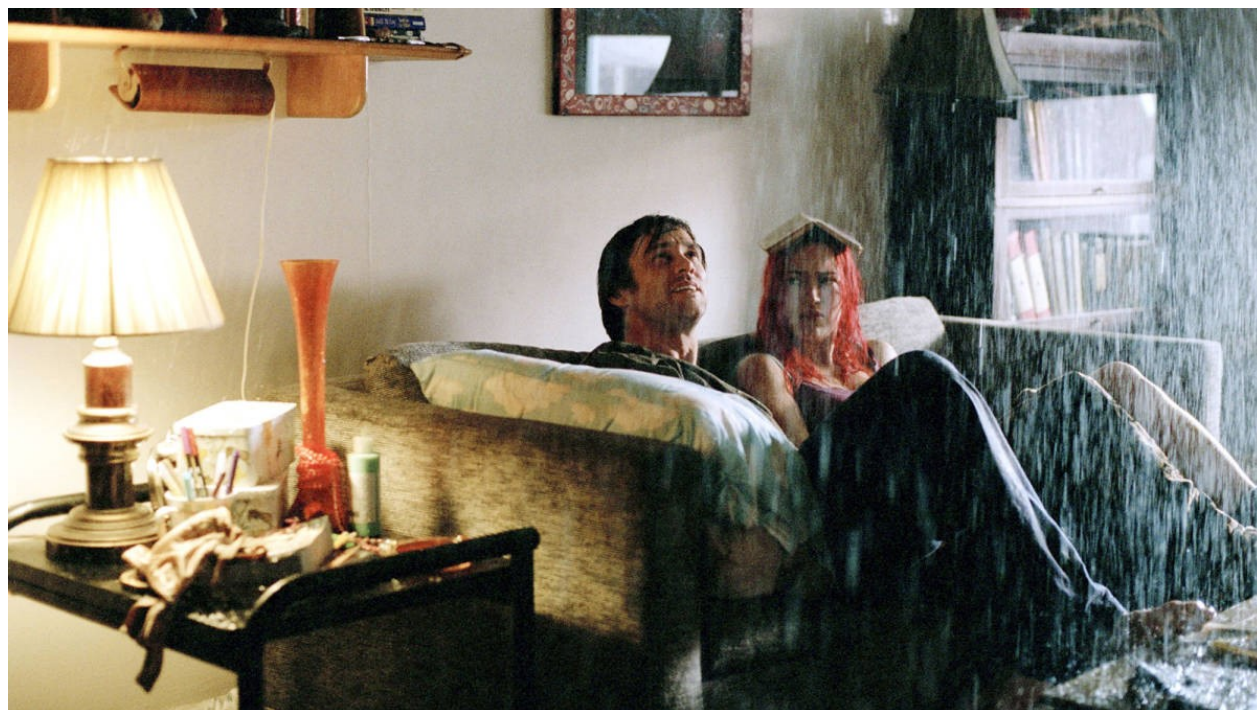
Eternal Sunshine of the Spotless Mind (Gondry, 2004)

Ciò che appare segnatamente prolifico nell'articolato impianto concettuale allestito dall'autore sono le sue implicazioni per l'analisi dei prodotti audiovisivi. In particolare, il lavoro di Paolucci consente di aprire piste di ricerca innovative in relazione al problema del punto di vista nella rappresentazione audiovisiva . Un problema che si dimostra oggi quanto mai urgente, a fronte dell'ascesa di forme come quelle proposte dalla realtà virtuale, mista e aumentata, che – secondo gli schemi enunciativi tradizionali – sembrerebbero contraddistinte da una sorta di “condanna” alla visione in prima persona. Seguendo il Christian Metz di L'enunciazione impersonale , Paolucci rifiuta l'applicazione delle strutture del linguaggio verbale a quello audiovisivo. Non esistono forme del linguaggio cinematografico che corrispondano univocamente a un io, oppure a un tu. Tuttavia, a differenza del suo predecessore, Paolucci non rinuncia a un tentativo di definizione di un apparato formale dell'enunciazione audiovisiva . Per farlo, privilegia quelle situazioni in cui la messa in immagine manifesta un carattere ibrido, di mobilità e compresenza, che metta al riparo dall'assertività ingombrante di chi pretende in modo esclusivo e autoreferenziale di dire “io”.