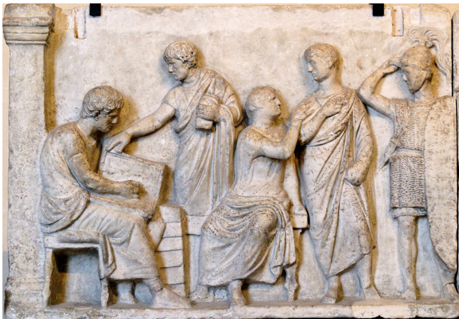
Partie gauche d'une plaque de l'autel de Domitius Ahenobarbus, connue sous le nom de la « frise du recensement ». Marbre, œuvre romaine de la fin du IIe siècle av. J.-C. Provenance : Champ de Mars, Rome. Paris, Musée du Louvre (Department of Greek, Etruscan and Roman Antiquities, Denon, ground floor, room 22).

taglia del fiume Trebbia con un doppio esercito consolare formato da quattro legioni, riportando quindi implicitamente il numero delle legioni originariamente presenti in Gallia a due 13 .