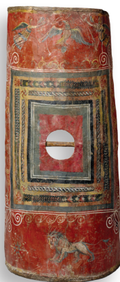
Scutum di Dura Europos, unico esemplare pervenuto.