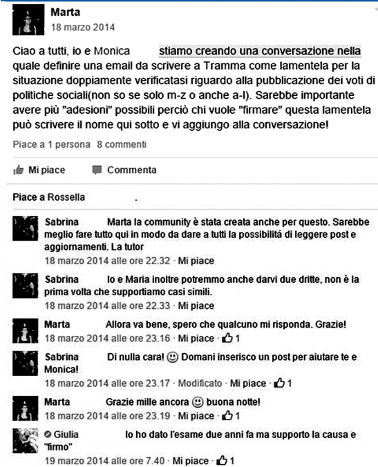
Figura 2. Esempio di Student Voice nelle community ufficiali degli studenti su Facebook.

Queste percezioni sembrano legate alle situazioni maggiormente complesse, dove lo studente, proprio perché ha bisogno di aiuto, fatica a trovare l'interlocutore giusto nell'ampia sfera dei servizi universitari. È necessario, quindi, partire da qui, perché legittimare le opinioni degli studenti dà l'opportunità a “chi è sopra” di guardare il mondo da un'altra prospettiva (Clark, 1995) adottando miglorie e aggiustamenti che si rivelano strategici all'interno delle pratiche didattiche ed educative; d'altra parte, anche gli studenti si sentiranno incentivati e motivati (Hudson-Ross, Cleary, & Casey, 1993) sia a far sentire la propria voce che a prendere parte alle politiche universitarie. L'utilizzo del social network si sposa con il desiderio 2 di incrementare la Student Voice anche a livello universitario. Infatti, un numero sempre in aumento di giovani utilizza i nuovi media e in particolare i social network per esprimere le proprie opinioni, le proprie identità e per connettersi con i pari, e questa tendenza è anche interpretata come un'occasione per incoraggiare i giovani ad esercitare forme di cittadinanza (Rheingold, 2008). Esprimere le proprie opinioni e far sentire la propria voce a qualsiasi livello rispet-