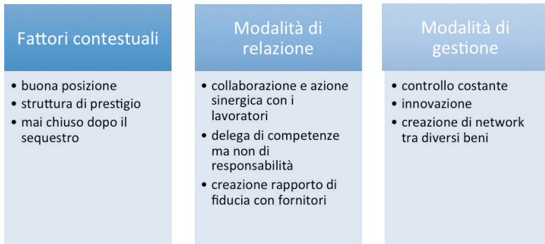
Figura. I fattori di successo

In conclusione, sembra utile sintetizzare quelli che in base all'analisi possono essere considerati i principali fattori di successo di questo caso. In particolare, possono essere individuati alcuni fattori contestuali, già dati al momento dell'acquisizione del bene: la buona posizione e il fatto che si trattasse comunque di una struttura di prestigio. Altre due categorie, invece, riguardano le modalità scelte dall'amministrazione per relazionarsi con i diversi attori che gravitano intorno e all'interno della struttura e le modalità di gestione dell'attività economica.