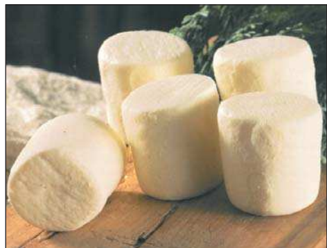
Agri di Valtorta

La collocazione dell'area la pone infine in condizione di integrare il progetto di