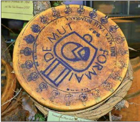
Formai de mut dop