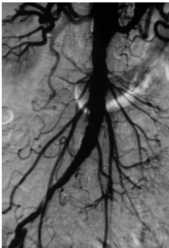
Fig. 5.3. Occlusione asse iliaco-femorale sinistro.