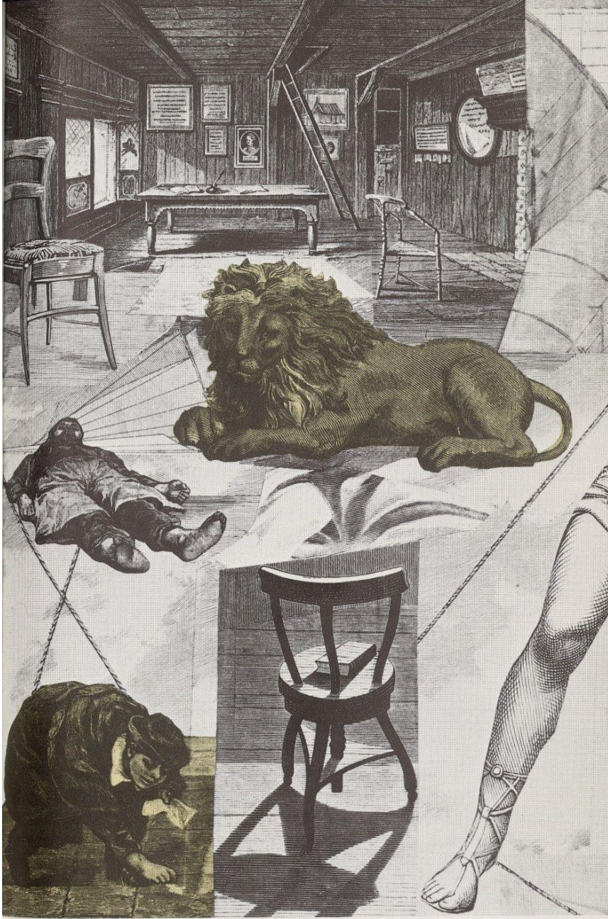
Abb. 3 – Aus: Peter Weiss: Fluchtpunkt . Roman. Mit vier Collagen von Peter Weiss. Suhrkamp. Frankfurt a.M. 1983, nicht nummerierte Seite (55)