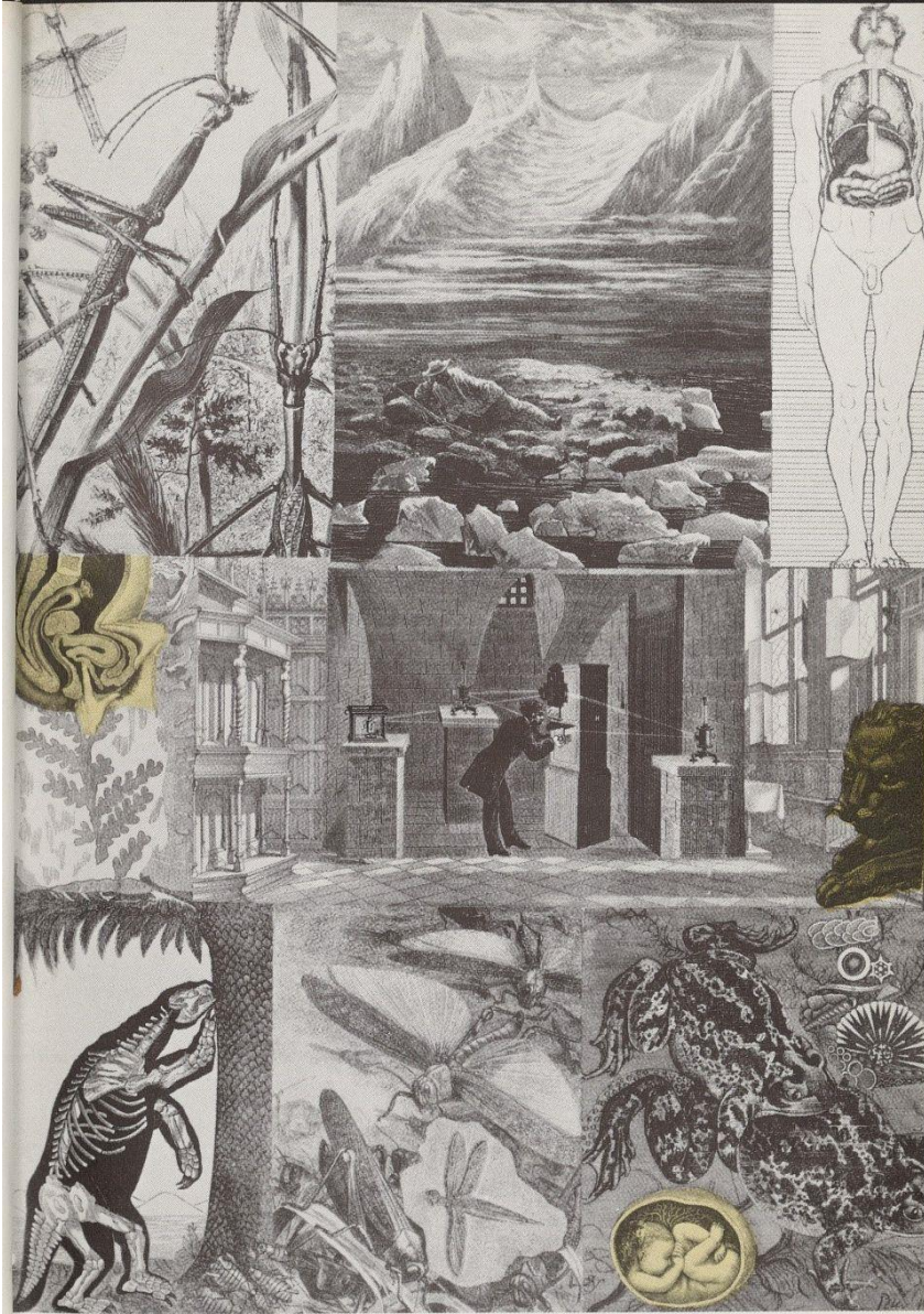
Abb. 4 – Aus: Peter Weiss, Fluchtpunkt . Roman. Mit vier Collagen von Peter Weiss. Suhrkamp. Frankfurt a.M. 1983, nicht nummerierte Seite (5)

Ich habe hier ein gewisses Skelett, das ich vielleicht später noch vervollständigen kann. Wie das Skelett eines verschollenen Tieres, das man aus eigenen