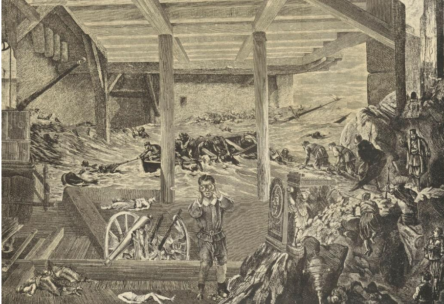
Abb. 2 – Aus: Peter Weiss: Abschied von den Eltern. Erzählung. Mit 8 Collagen des Autors sowie einer separaten, vom Autor signierten Collage. Suhrkamp. Frankfurt a.M. 1980, S. 12-13

Das große Welttheater , Schiffsbruch, Zerstörung, Untergang und Tod 60 . Das im Vordergrund stehende Kind, von dem Katastrophenszenario durch einen Balken getrennt, distanziert sich vom Geschehen, das wie ein Guckkastentheater wirkt, indem es dem Grauen eindeutig den Rücken kehrt und durch ein Fernglas in die Außenwelt blickt. Ähnliche Erfahrungen begleiten den Protagonisten von Abschied von den Eltern , der sich häufig vor der Gewalt der ihn unmittelbar umgehenden Wirklichkeit flüchtet. Ein paradigmatisches Beispiel bilden die Episoden, in denen der Junge, vom Vater gezwungen, mit ihm ins Kontor zu gehen, sich ins nebenan liegende Theater zurückzieht und durch »Sauggläser« stereoskopische Szenen betrachtet (AvdE, 77) oder unruhig den Kontorbetrieb aus der Distanz durch eine Glasscheibe beobachtet (AvdE, 78). Weiss bedient sich in seiner Collage