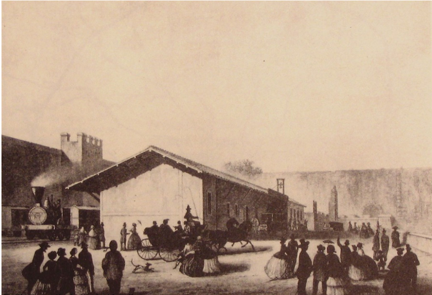
Figura 2. La prima stazione romana: Porta Maggiore nel 1856.