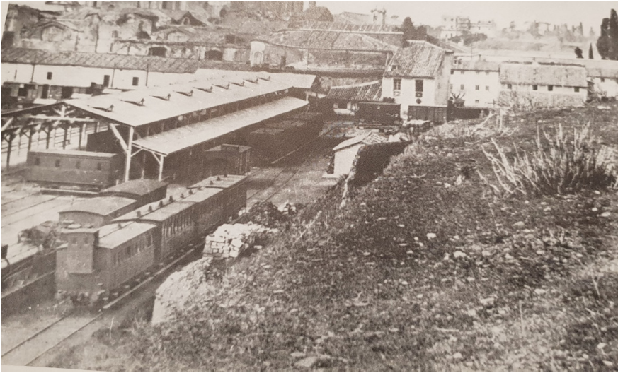
Figura 4. La Stazione centrale delle ferrovie (Termini) nel 1860.