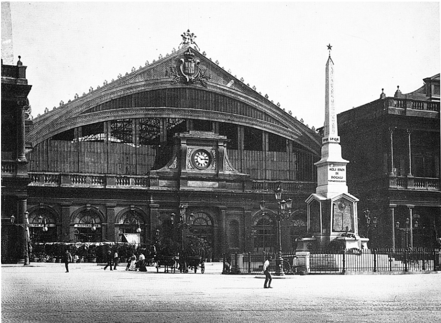
Figura 5. La Stazione Termini realizzata su progetto dell'Arch. Bianchi.