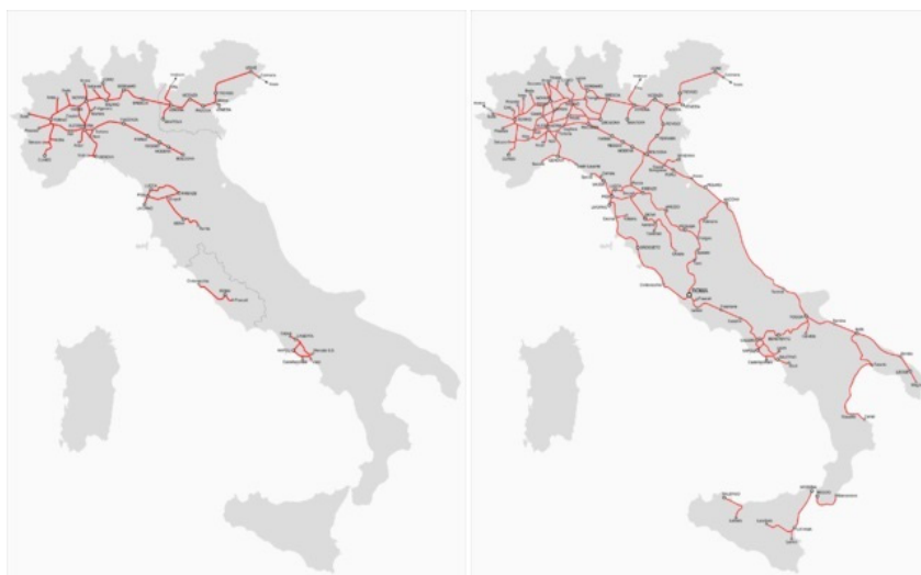
Rete ferroviaria italiana il giorno dell'Unità d'Italia (17 marzo 1861)