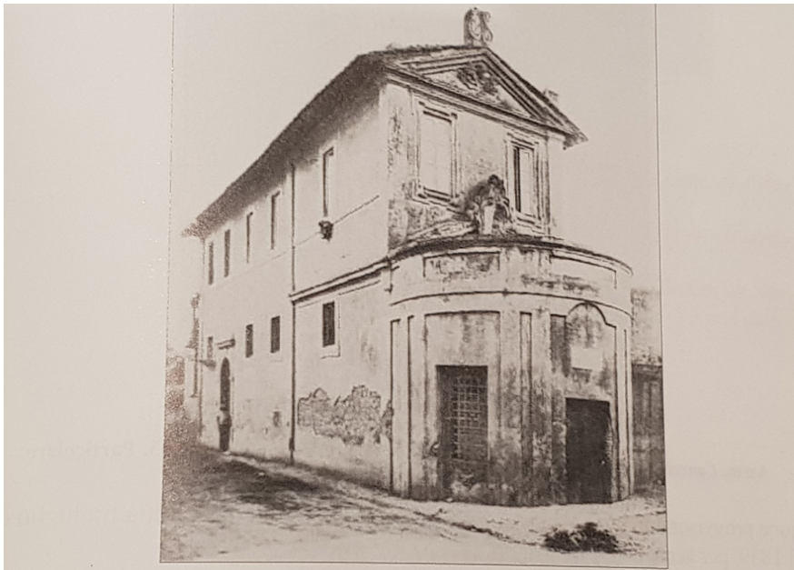
Figura 3. La chiesa di Santa Maria del Riposo e il fabbricato della stazione di Porta Portese in una foto del 1908.