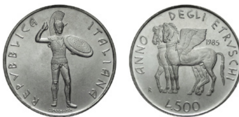
Fig. 2 – Moneta da L. 500 emessa nel 1985 in occasione dell'anno degli Etruschi (conio cesellato da Uliana Pernazza).

L'intervento di Vagheggi terminava riconoscendo, tuttavia, come la celebrazione sarebbe risultata di sicuro successo, con il pienone di turisti “ forse affaticati dal pesantissimo e gigantesco catalogo di tutte le manifestazioni che la Electa ha curato per conto della Regione Toscana. In tutto sono otto volumi: una vera enciclopedia ” 102 . Ogni mostra legata all'Anno etrusco venne, in effetti, accompagnata dalla pubblicazione di ampi e approfonditi cataloghi; tuttavia, solo in poche pagine di questi e solo in taluni volumi trovava spazio un qualche approfondimento numismatico.