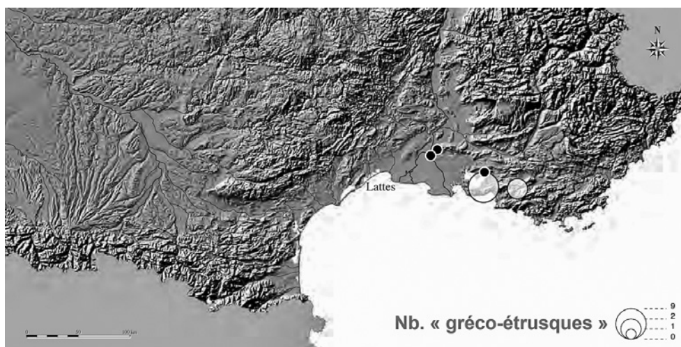
Fig. 3 – Luoghi di provenienza delle serie cosiddette “greco-etrusche” (da PY 2006, II, p. 706).

in area provenzale (Fig. 3) sembrerebbero descrivere la produzione come più consona a questa seconda area 168 .