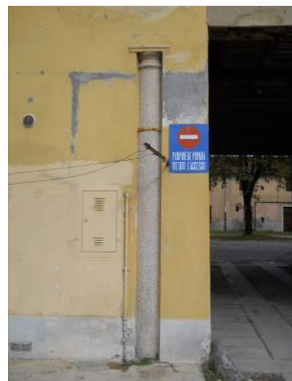
Figg. 16-19. Edificio padronale a tre piani; colonne in granito e scala