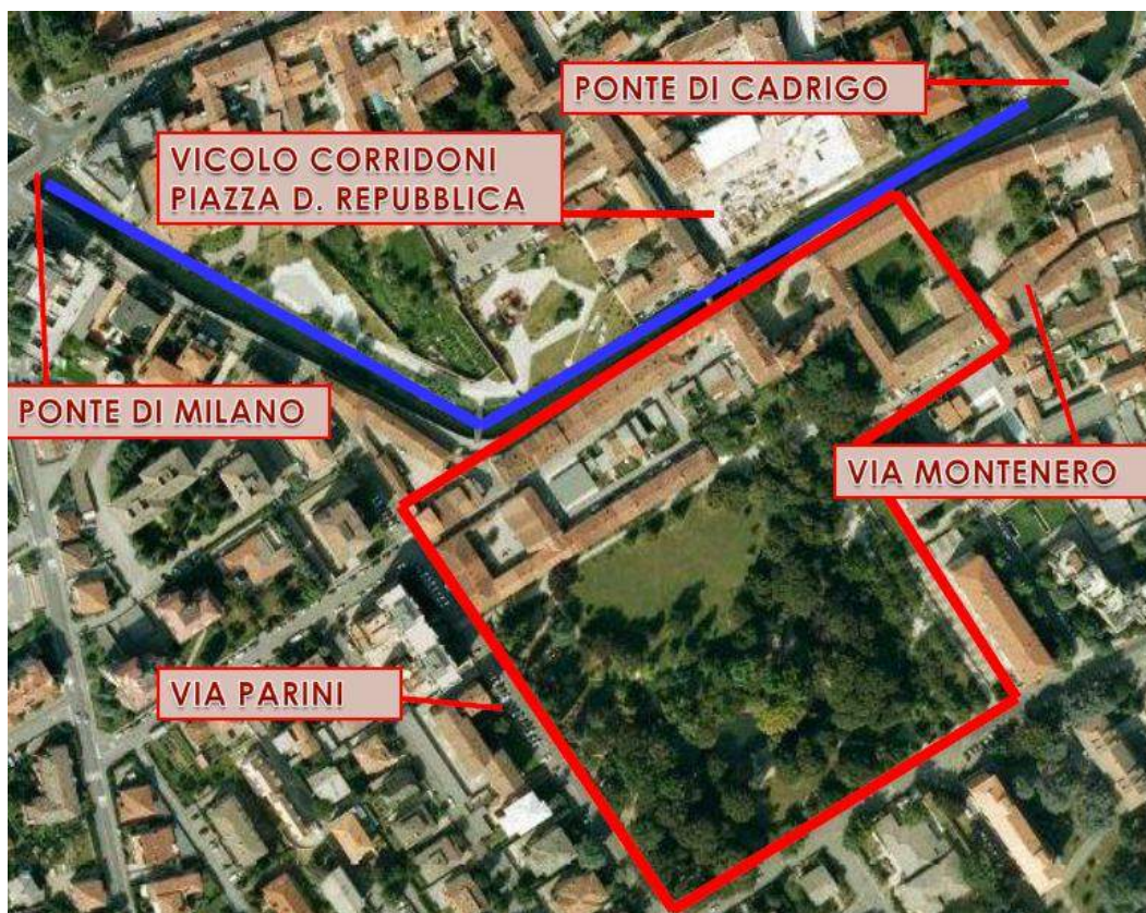
Fig. 2. Vista aerea del complesso di Ca' Busca

Definiti gli aspetti terminologici del problema, bisogna ora tracciarne i confini geografici, individuare, cioè, sulle mappe e sulle fotografie aeree quali edifici compongono l'insieme di villa Serbelloni. L'edificio padronale, dove risiedevano i signori, è facilmente identificabile per l'alta torre che lo sovrasta: si sviluppa perpendicolarmente al naviglio, è un blocco rettangolare compatto, che si differenzia dal resto delle basse costruzioni circostanti per i suoi tre piani. Tutti gli altri edifici, raccolti attorno a corti, più o meno vaste, erano invece abitazioni, stalle, pollai, fienili, laboratori, rimesse e magazzini: tutto l'occorrente per il perfetto andamento della più grande azienda agricola di Gorgonzola. Si intuisce bene come la maggior parte delle costruzioni e degli spazi aperti fossero destinati a scopi produttivi, mentre la zona riservata alla residenza padronale fosse molto ridotta e il padrone preferisse abitare al centro di questa grande azienda, per meglio controllarne l'andamento.