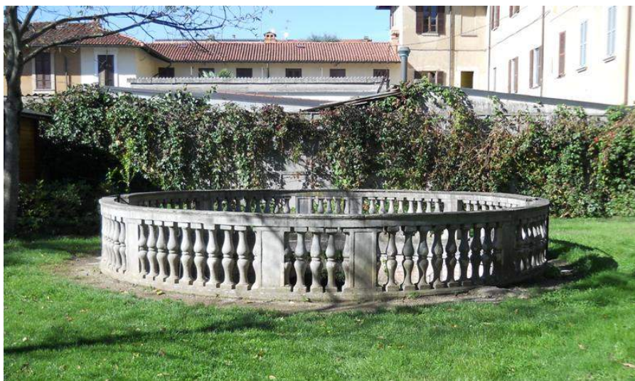
Fig. 34. La peschiera circolare, dove scorrono le acque del naviglio dirette al laghetto del parco