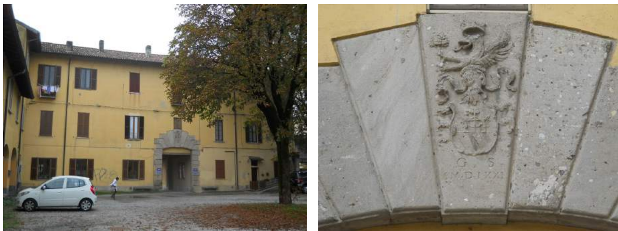
Figg. 21-22. Portale bugnato sulla corte “del pino” e stemma di Gabrio Serbelloni (1571)