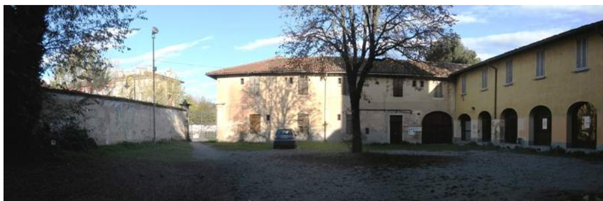
Fig. 20. Corte d'onore o corte “del pino”

Lo spazio cui si accede attraverso questo passaggio è nota come “ corte del pino ” (l’albero è stato sostituito decenni fa da un ippocastano, al centro della corte) ed è la vera corte d’onore di villa Serbelloni, sulla quale si apre il cancello in ferro battuto che dalla strada alzaia permetteva l’accesso carraio ufficiale alla villa. Il portale, affiancato da due panche in pietra, è definito da un imponente paramento a bugnato e nella chiave di volta è scolpito lo stemma gentilizio dei Serbelloni: uno scudo con il campo inferiore a bande oblique e quello superiore con due leoni affrontati e al centro un albero; un grifone che regge un piccolo arbusto sormonta l’elmo che sovrasta lo scudo. Da notare che l’elemento dei leoni rampanti che si fronteggiano è passato poi nello stemma del Comune di Gorgonzola, dove però l’albero è sostituito da una torre.