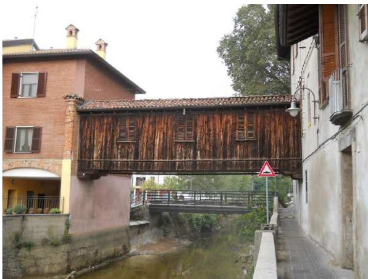
Figg. 25-26. Passerella di vicolo Corridoni (Puncerta) e passaggio coperto: ieri e oggi