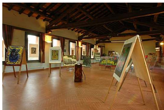
Figg. 6-7. Biblioteca: piano terra, primo piano