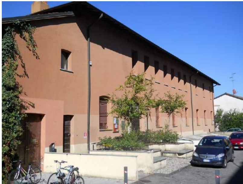
Fig. 4. Biblioteca civica "Franco Galato"