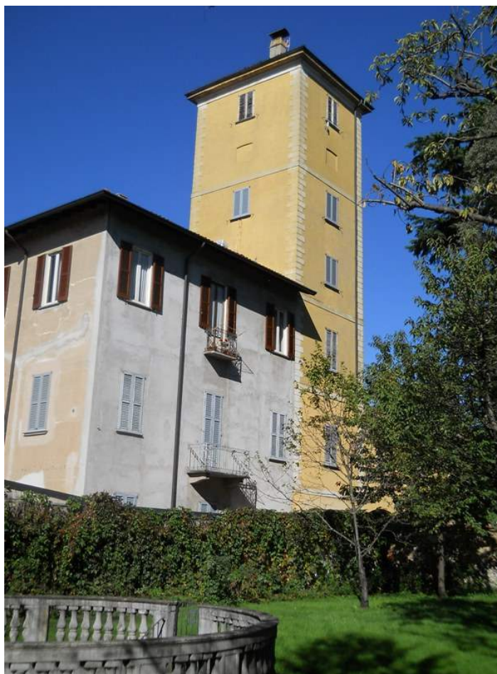
Fig. 1. La torretta di Ca' Busca vista da Sud-Ovest

Quanto segue è il risultato di una prima ricerca finalizzata a delineare un profilo monografico coerente (e sinora mancante) di quel complesso di edifici di Gorgonzola, noto a livello locale con il nome di Ca' Busca . L'oggetto dell'indagine è stato affrontato nei suoi vari aspetti - dal punto di vista storico, architettonico, culturale, documentario - ma ciò non toglie che quanto si presenta in questa sede abbia e voglia avere un carattere di introduzione al tema, ben lungi dal ritenersi esaustivo e, men che meno, definitivo. Si è voluto, in pratica, delineare i termini della questione, fissando alcuni punti fermi in merito.