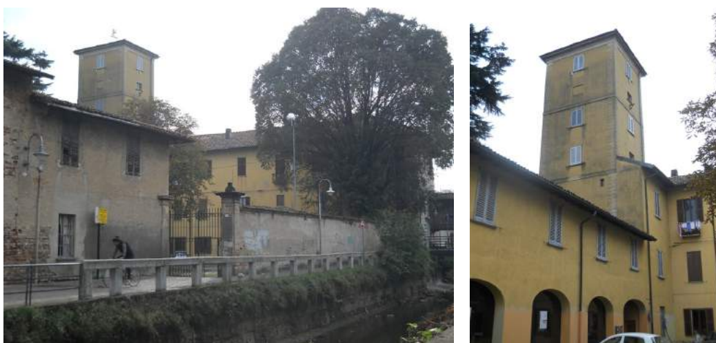
Figg. 23-24. Accesso carraio dall’alzaia del naviglio Martesana e Torretta Busca

Non abbiamo informazioni sull’aspetto interno della villa, se ci fossero sale decorate e su come fossero organizzati gli appartamenti 12 . Solo un testo del 1866 dello storico Muoni 13 cita la presenza di una sala da pranzo al piano terra e una camera da letto “ oblunga ” al piano superiore, con l’ Aurora affrescata sulla volta; mentre la torre, alta circa 25 metri, era stata “ fabbricata dalla marchesa Luigia Busca ”. Questo significa che nel corso della prima metà dell’Ottocento (Luigia Busca ereditò dal padre Gian Galeazzo, morto nel 1802, e scomparve nel 1849) la torretta fu sostanzialmente ricostruita, forse sopraelevata o ingrandita. Si pensa, infatti, che una torre e qualche resto di fortificazione dovevano già esistere in questa zona, dal momento che la prima residenza dei Serbelloni sorse sopra i resti del castello medievale (XIII secolo) che occupava l’area a presidio del passaggio sul fossato.