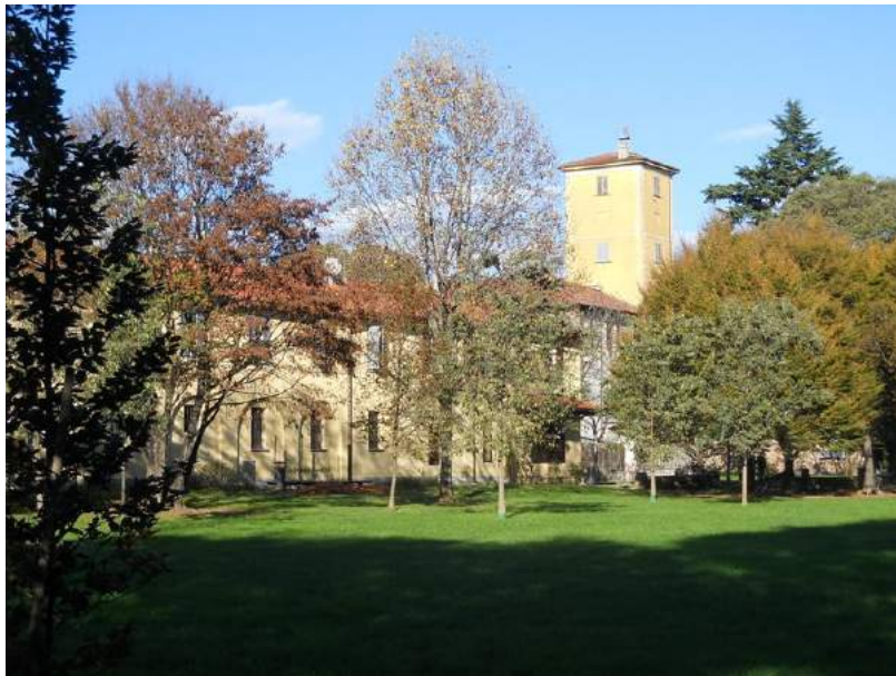
Fig. 5. Parco pubblico "conte Gian Ludovico Sola Cabiati"