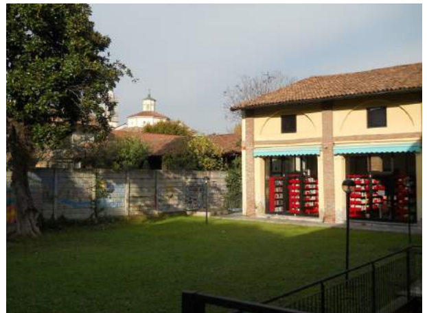
Figg. 8-11. Biblioteca (in senso orario): piano interrato e cantina, cortile interno verso Nord-Est e verso Nord-Ovest