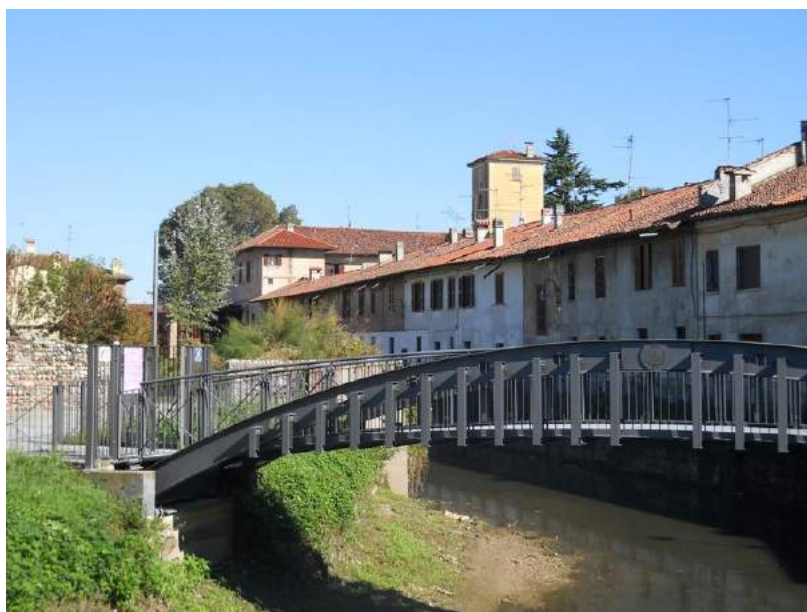
Fig. 12. Ca' Busca vista dalla passerella nei pressi di via Parini

Un possibile itinerario di scoperta, o di ri-scoperta, potrebbe aver inizio sull'ansa del naviglio Martesana, dove un arco permette di entrare in un cortile di passaggio, dove è un lavatoio e l'accesso ad altre corti: è la corte popolarmente nota come “ curt brusada ”. In questo spazio si segnalano alcuni episodi minori: una vasca per la raccolta dell'acqua sembra essere il riuso di un vaso in pietra bianca scolpito in stile Neoclassico, affiancato da una pompa per l'acqua che ancora mostra la targhetta con il nome del suo autore, il ramiere Brambilla Flaminio di Gorgonzola 8 .