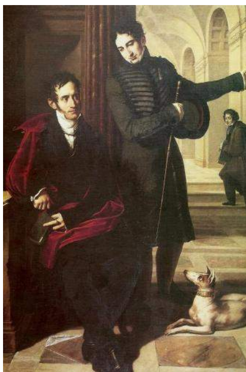
Fig. 33. Francesco Podesti, Ritratto dei marchesi Busca con autoritratto del pittore (1825)

Gian Galeazzo era noto come personaggio brillante e abilissimo nel saper spendere, capace di provocare nei suoi interlocutori ammirazione e stupore per i suoi atteggiamenti di magnificenza. Pur tuttavia, era il feudatario di Gorgonzola e in quanto tale era il titolare di ogni diritto di caccia e pesca sul territorio. Con un'istanza 32 al governo austriaco, nel 1789, ribadiva di ritenersi esentato dal divieto, che era stato imposto a tutti, di pescare nel naviglio in tempo di asciutta, accedendo al letto del canale con badili e altri strumenti. Questa pratica, oltre che danneggiare le opere idrauliche, ledeva i diritti acquisiti con l'acquisto del feudo nel 1689 33 e il duca, nell'anno della rivoluzione francese, intendeva ribadire il suo status .