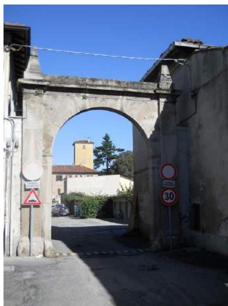
Figg. 13-14. Vasca e pompa dell'acqua; portale verso via Parini

Se non fosse per il piano in più, l'abitazione padronale non si distinguerebbe molto da quelle vicine: le finestre si aprono secondo un impianto regolare, non sembrano esserci cornici in pietra lavorata. Unico elemento che ingentilisce un edificio piuttosto severo sono i balconi, probabilmente originali, che sporgono dall'ultimo piano: tre verso la corte " del pino " (uno in asse al portale e due ai margini della facciata) e uno verso il parco, sotto la torretta. Un balcone di dimensioni maggiori, ma accomunato ai precedenti dalla medesima ringhiera, sporge al piano intermedio, verso il parco. Ci sono poi, inserite nel muro, due coppie di colonne di granito rosa e grigio, forse tutto quello che resta di un precedente portico, avrebbero potuto reggere un architrave rettilineo o un'arcata a tutto sesto. Si trovano nei pressi dell'elegante scalone che dà accesso ai piani superiori dell'edificio: gradini in pietra e ringhiera in ferro battuto, ha un andamento quasi ovale.