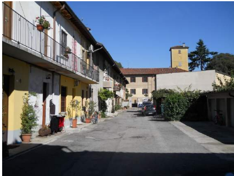
Fig. 15. Corte principale