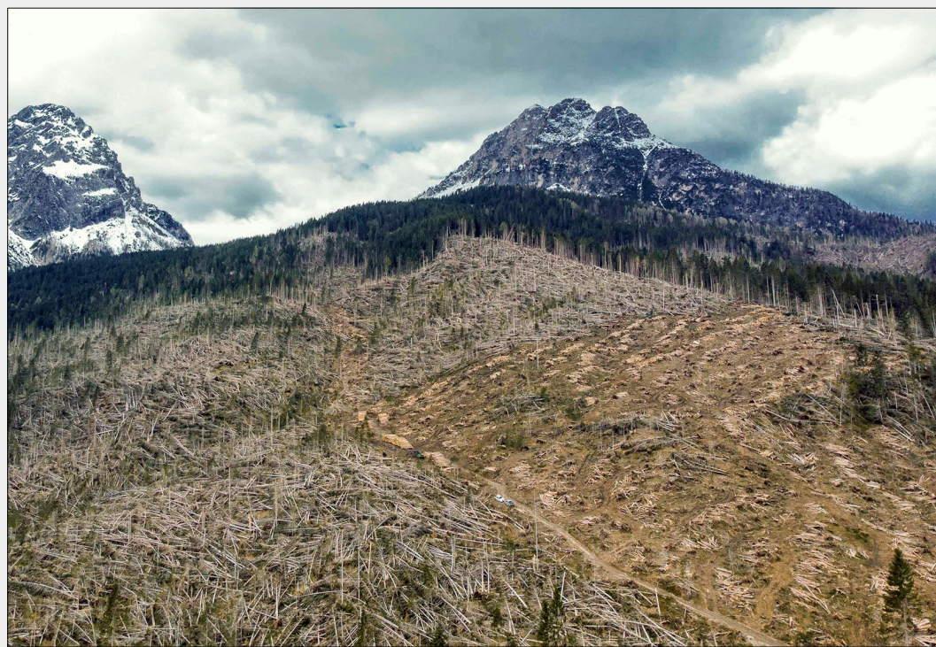
Fig. 1 - Paluzza (UD). La tempesta Vaia ha provocato alla fine di ottobre 2018 l'abbattimento di oltre 42 000 ha di foresta e di oltre 4 milioni di metri cubi di legname. Le statistiche del post-evento sono in fase di continuo aggiornamento, ma nel corso del 2019-2020 sono stati raccolti nelle regioni e nelle province autonome del nord-est oltre 2,5 milioni di metri cubi di legname (di cui circa il 50% nel corso del 2019) che non risultano in modo adeguato e coerente nelle statistiche forestali disponibili.

proveniente da foresta ma da scarti e legname riciclato (imballaggi in legno, ad esempio), anche se c'è una evidenza empirica che gran parte di queste biomasse siano utilizzate per impieghi industriali.