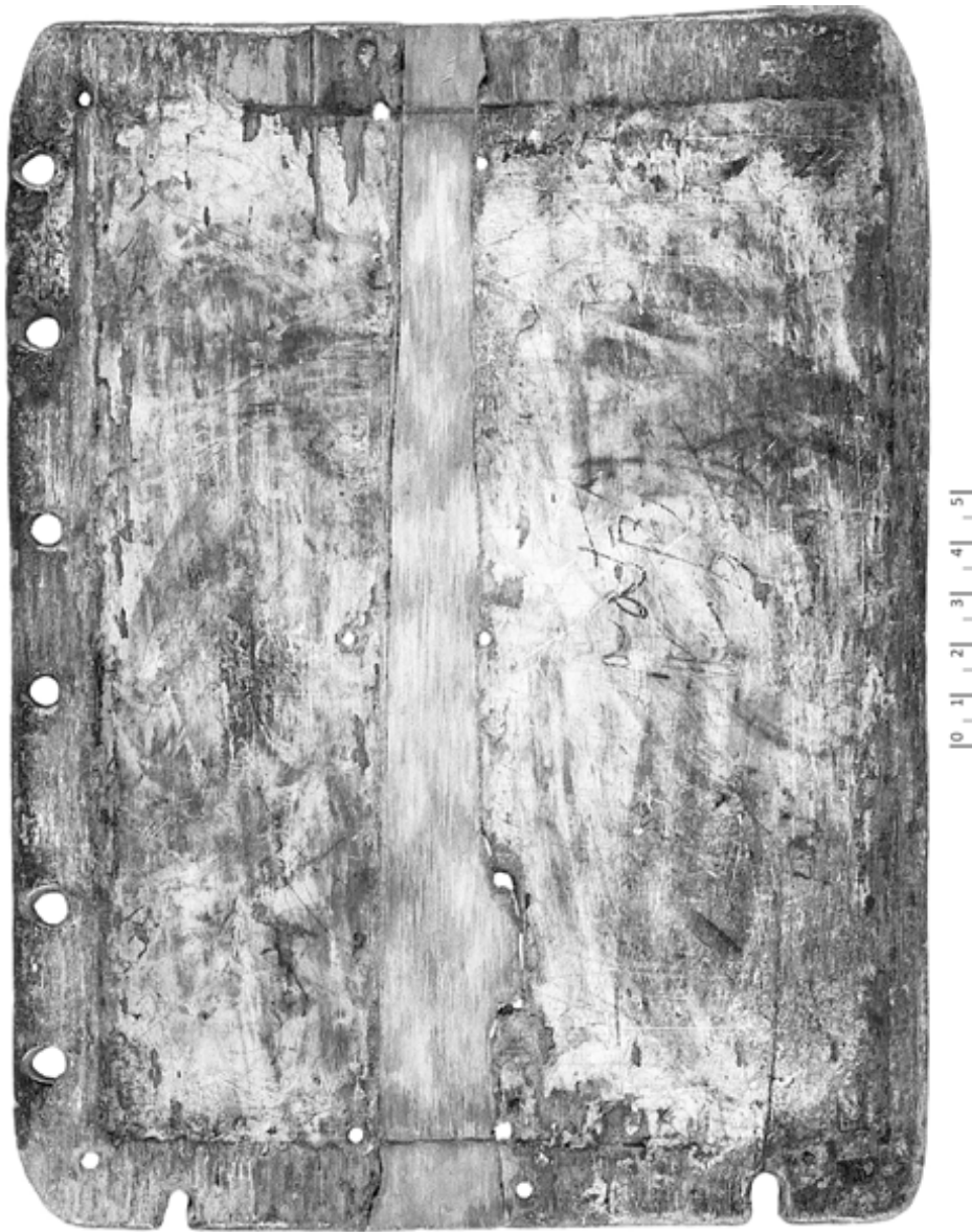
15. Tavole di moltiplicazioni e divisioni (Tav. 2 a = T.Louvre inv. MND 551 C a) (VII/VIII P )