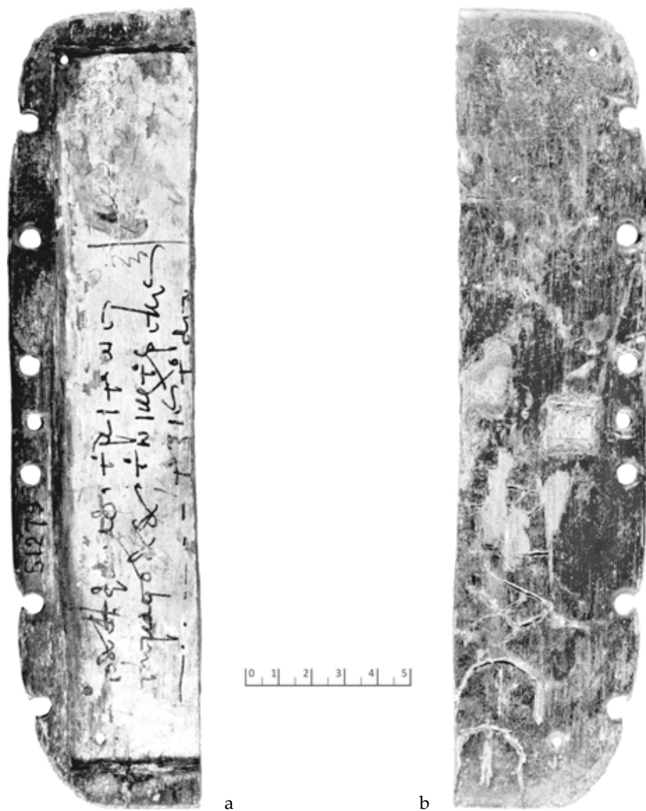
15. Tavole di moltiplicazioni e divisioni (Tav. 4 a-b = T.Cair. inv. JE 51279 a+b) (VII/VIII F )