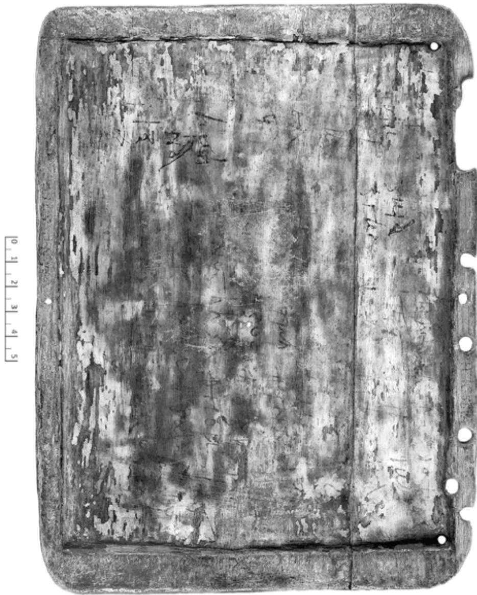
15. Tavole di moltiplicazioni e divisioni (Tav. 1 b =T.Louvre inv. MND 551 A+C b ) (VII/VIII e )