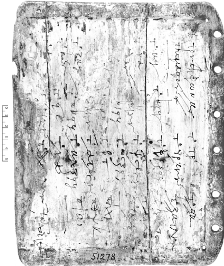
15. Tavole di moltiplicazioni e divisioni (Tav. 3 b = T.Cair. inv. JE 51278 b) (VII/VIII F )