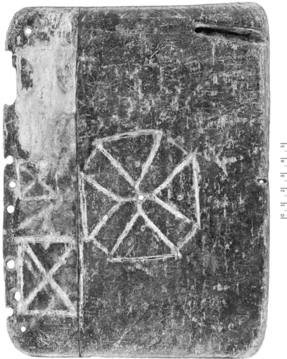
15. Tavole di moltiplicazioni e divisioni (Tav. 1 a = T.Louvre inv. MND 551 A+C a ) (VII/VIII e )