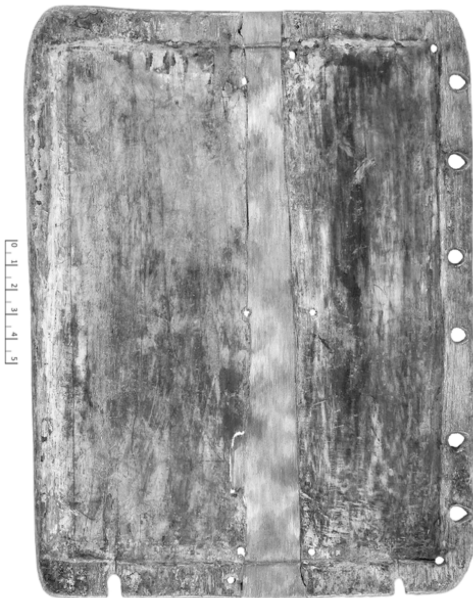
15. Tavole di moltiplicazioni e divisioni (Tav. 2 b = T.Louvre inv. MND 551 C b ) (VII/VIII F )