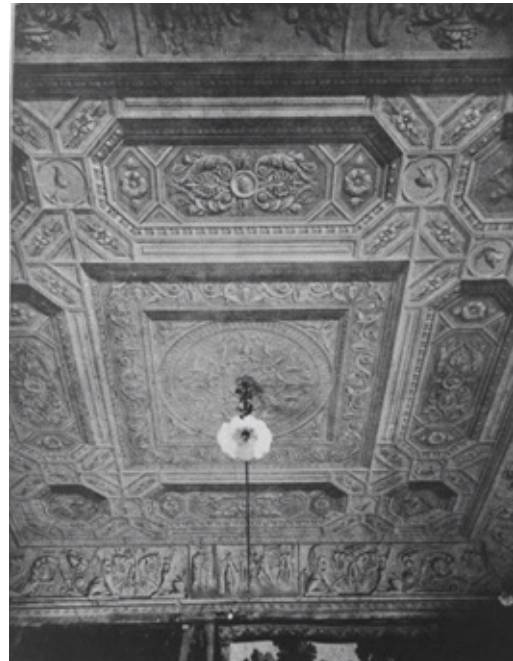
Fig. 2. Soffitto del primo salone di rappresentanza in una veduta del 1932.