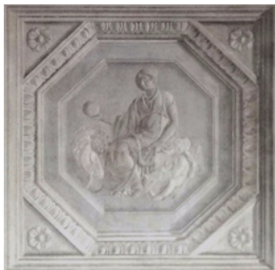
Fig. 9. PIETRO MARIANI, Figura allegorica in una delle camere da letto dell'appartamento di riserva dei principi nel Palazzo Reale di Milano, 1836 circa.