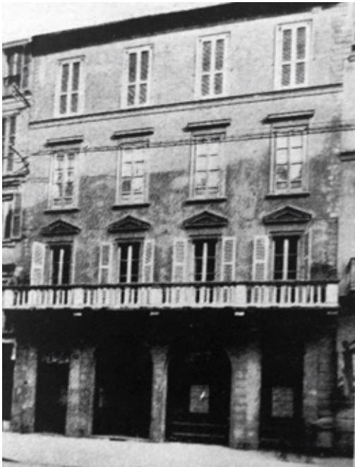
Fig. 1. Facciata dello stabile in una veduta del 1932.