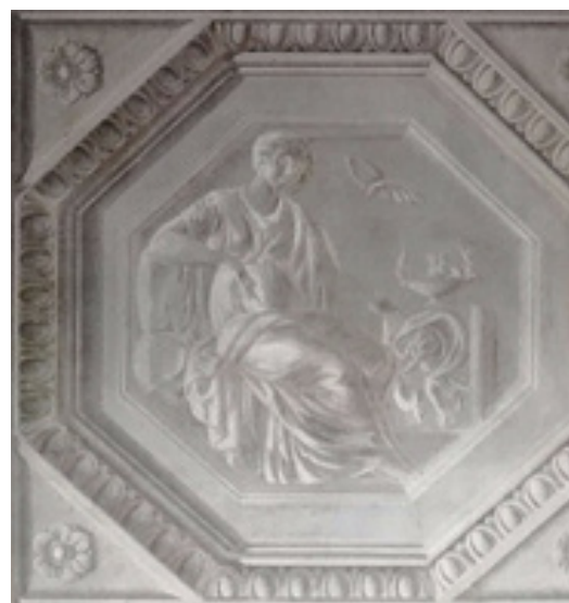
Fig. 10. PIETRO MARIANI, Figura allegorica in una delle camere da letto dell'appartamento di riserva dei principi nel Palazzo Reale di Milano, 1836 circa.