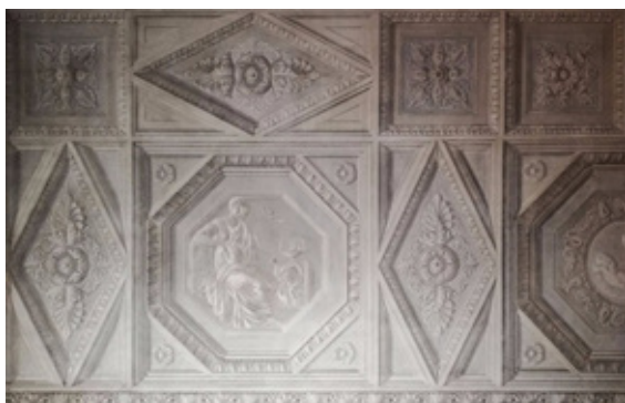
Fig. 7. PIETRO MARIANI, Dettaglio del soffitto di una delle camere da letto dell'appartamento di riserva dei principi nel Palazzo Reale di Milano, 1836 circa.