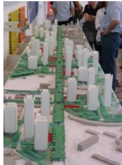
Figura 3: Immagini e plastico tratti del progetto di Renzo Piano per il recupero delle aree un tempo occupate dalla produzione delle Acciaierie Falck.