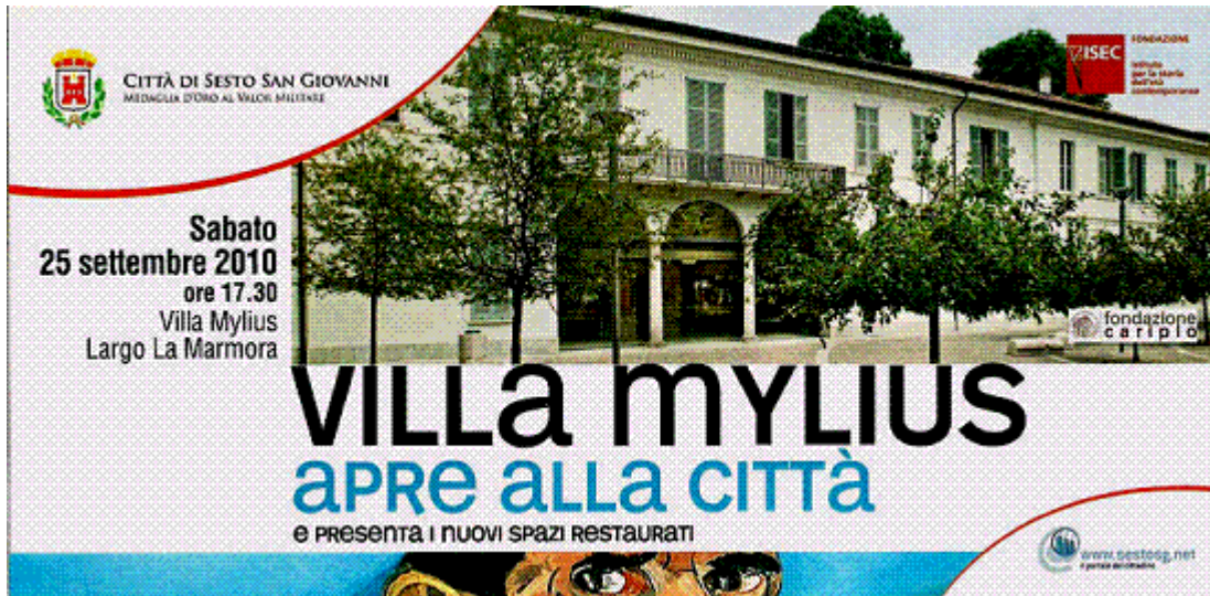
Figura 4: Locandina che ricorda la riapertura di Villa Mylius dopo i recenti lavori conservativi. La villa, di proprietà comunale, è affidata in comodato d'uso al Centro studi dedicato alla storia dell'età contemporanea (ISEC) e ospita iniziative culturali al servizio della cittadinanza.

Tra le sfide poste dalla rigenerazione di Sesto San Giovanni vi sono pure quelle legate alla fruizione del verde perché i parchi Nord Milano e della Media Valle del Lambro rientrano in parte nella superficie del Comune. Questi parchi, inserendosi in un territorio complesso, minacciato dalla speculazione edilizia, modificato da una storia industriale invasiva, ferito dalla presenza di cave di estrazione (oggi fortunatamente dismesse) e di scorie dell'industria siderurgica, rivestono inevitabilmente un ruolo strategico di contrasto della problematicità delle aree urbane congestionate, dell'inquinamento e del rischio idro-geologico (Adorno, Neri Sarneri 2009). Tuttavia il Parco Nord Milano e il Parco della Media Valle del Lambro sono parte di un sistema del verde metropolitano più ampio che comprende anche il Parco della Villa Reale di Monza, il Parco Est delle Cave, il Naviglio Martesana e altri parchi di interesse sovracomunale che, come tali, diventano anche corridoi ecologici e spazi aperti all'educazione ambientale, alla fruizione del tempo libero, alle attività sportive, alla visita di monumenti e delle architetture rurali che ricordano il tempo precedente quello dell'industrializzazione. L'apertura o il potenziamento di green e blue ways (piste ciclopedonali, circuiti botanici e faunistici, percorsi vita e sportivi, sentieri tematici) rispondono anch'essi alle nuove esigenze portate avanti dalla società postindustriale (Gavinelli, Molinari e Pagani 2008).