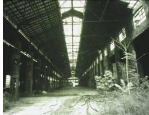
Figura 2: Aree dismesse Falck: la tenaglia dell’altoforno chiamato “Toro Seduto” (a sinistra) e l’interno del laminatoio dello stabilimento T5 Concordia (a destra).

Le modifiche fisiche effettuate negli ultimi decenni e apportate al paesaggio industriale dismesso sono diventate così la parte visibile di una rinnovata e più ampia progettualità che tiene conto delle opportunità del mercato globale, della necessità di reinventare l’immagine urbana e l’economia della città, di superare il dualismo città-fabbrica. Si sono pertanto avviate trasformazioni “epocali” nell’esperienza urbana di Sesto San Giovanni, con la costruzione di grattacieli e centri commerciali e la demolizione dell’edilizia tradizionale. Queste trasformazioni sono guidate da forze economiche, sociali, culturali e politiche non sempre operanti in sintonia, portatrici di esigenze a volte tra loro conflittuali, in nome della globalizzazione, della postmodernità, del post-fordismo e del neo-liberalismo (Dansero, Vanolo 2006). Ciò ha spinto i poteri locali a delineare traiettorie evolutive per la città, ad avviare strategie di trasformazione e sviluppo, a promuovere cambiamenti delle forme, a sostenere una nuova politica urbana attenta ai modelli di vita e di organizzazione sociale profondamente rinnovati, ad assecondare la comparsa delle cosiddette “imprese etniche”, a incentivare forme neo-industriali di produzione, ad aprirsi a nuovi settori come quello degli eventi e del turismo (Leone 2001; Santoro 2001; Guala 2007; Mastropietro 2008).