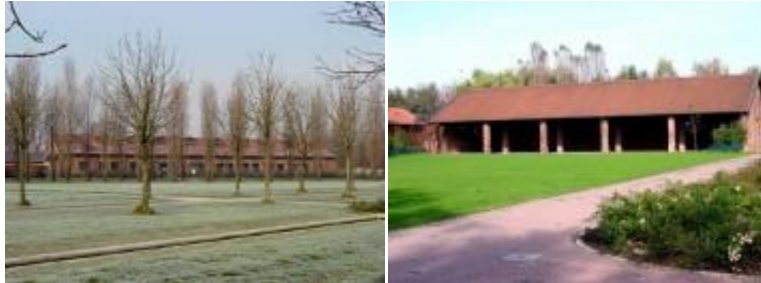
Figura 5: La Cascina Centro Parco a Sesto San Giovanni, sede dell'ente Parco Nord Milano. Essa ospita inoltre il Centro Visitatori, la biblioteca "Area Parchi" (Archivio Regionale per l'Educazione Ambientale) e uno spazio per mostre, eventi e incontri.