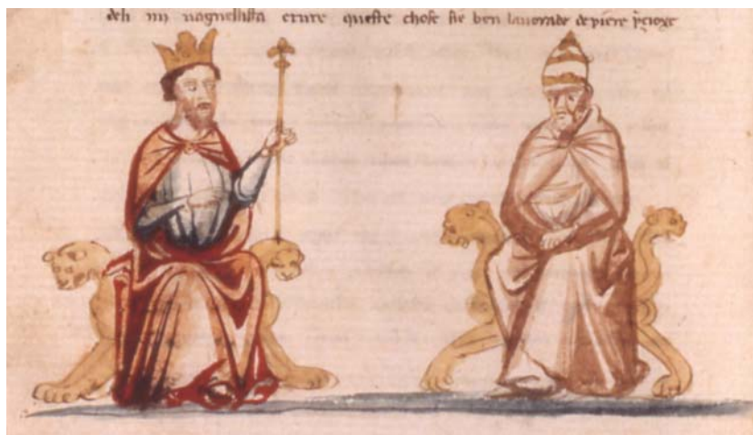
Tav. 5 – Paris, Bibliothèque nationale de France, it. 1708, c. 30v (part.)