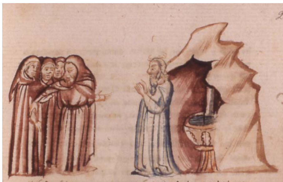
Tav. 4 – Paris, Bibliothèque nationale de France, it. 1708, c. 28r (part.)