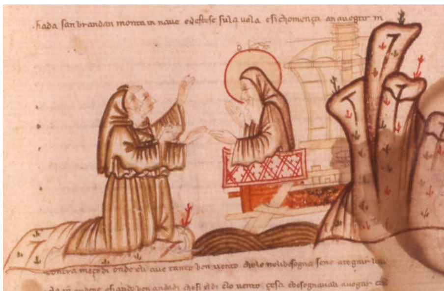
Tav. 1 – Paris, Bibliothèque nationale de France, it. 1708, c. 5r (part.)