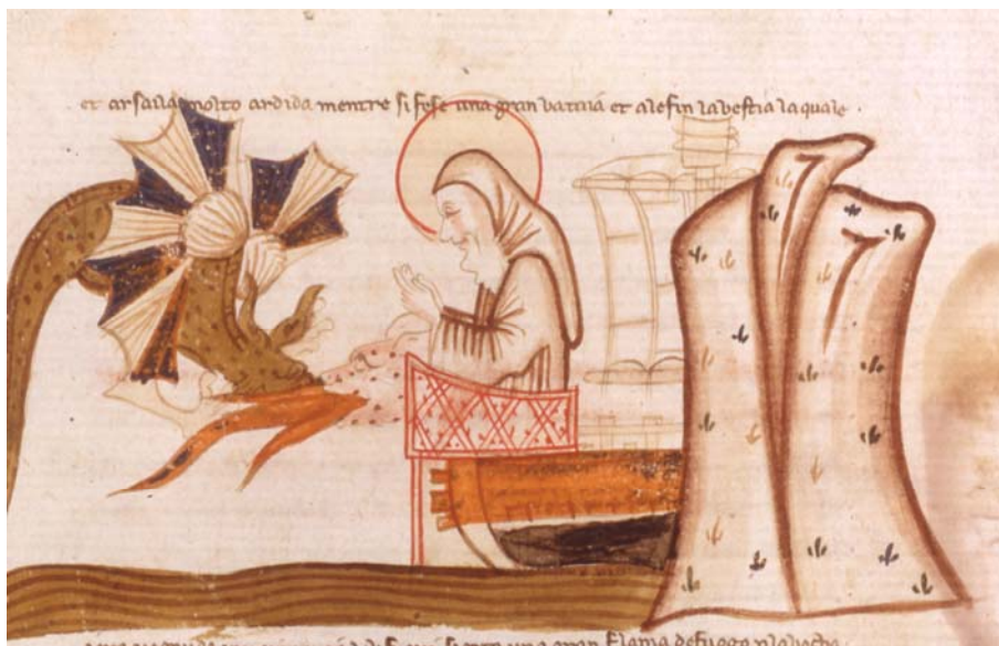
Tav. 2 – Paris, Bibliothèque nationale de France, it. 1708, c. 16r (part.)