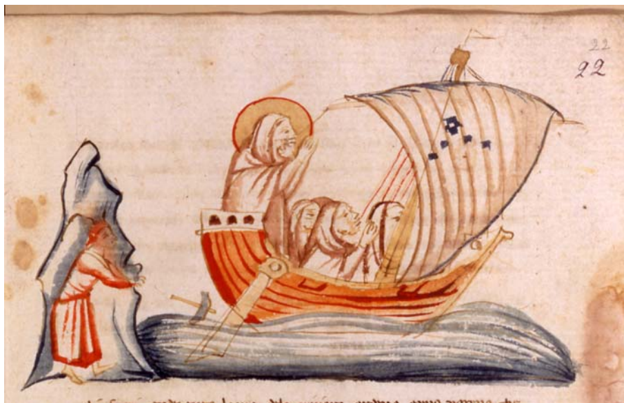
Tav. 3 – Paris, Bibliothèque nationale de France, it. 1708, c. 22r (part.)