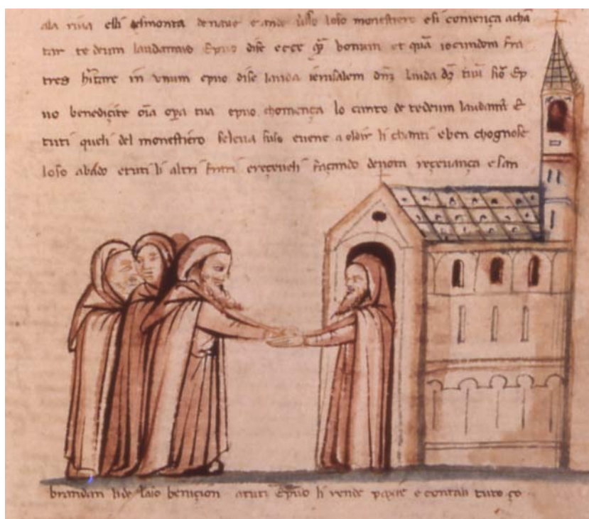
Tav. 6 – Paris, Bibliothèque nationale de France, it. 1708, c. 36r (part.)