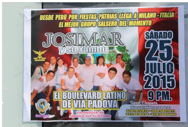
Imagen 13 Cartel de evento musical.

latinoamericana que se celebra cada verano, muy conocido también entre los italianos), y el español, 14 para los mensajes dirigidos más específicamente a la comunidad. De especial interés es el anuncio de la actuación del grupo salsero Josimar y su Yambu en el Boulevard Latino, una discoteca situada en Via Padova, la principal arteria del barrio punta de la inmigración latina , NoLo.