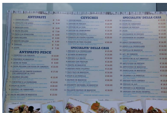
Imagen 11 El menú del restaurante El Chorrillano.

dessert ('postres'), bibite alcoliche ('bebidas alcohólicas'), bibite analcoliche ('bebidas sin alcohol'); se acude al español solo en el caso de los términos culturales: "ceviches", "menu' criollo". Aparte de algunas formas comprensibles pero poco usuales ( antipasto pesce en lugar de antipasti di pesce , bibite alcoliche en lugar de alcolici o bevande alcoliche ), se evidencia la voluntad de dar prioridad a la lengua de la mayoría, y sobre todo de acercarse a los destinatarios que no conocen el español ni, mucho menos, los platos peruanos: en efecto, en la denominación y descripción de los platos, se alternan las dos lenguas (además de algunas ocurrencias del inglés) en diferentes relaciones, como se verá. El propósito principal es el de facilitar la comprensión, tal como reafirmó el dueño a lo largo de la entrevista, precisando que hizo recurso a la ayuda de un amigo italiano (desde luego, no un profesional); pero se ve, al mismo tiempo, que la conciencia de proximidad hace descartar una traducción palabra por palabra, que hubiera resultado redundante. Por esto hablamos, en conjunto, de mediación, como estrategia de gestión del bilingüismo entre lenguas afines, gracias también a la intercomprensión (Calvi 2017b).