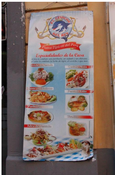
Imagen 1 Menú del restaurante El Ceviche del Rey.

suelen tener clara conciencia (Calvi 2015a). Es más, esta elección se convierte en un recurso para marcar la autenticidad.