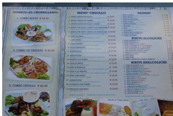
Imagen 12 Otro detalle del menú.