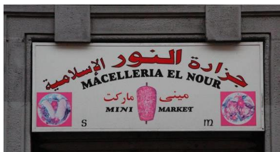
Imagen 6 Letrero de la carnicería El Nour.

simetría no es completa. En la Imagen 6, por ejemplo, la colocación de las palabras hace pensar en una traducción, pero no hay equivalencia completa entre las dos lenguas: en árabe se lee “Carnicería al-Nur islámica”, mientras que el elemento islámica , muy relevante para los musulmanes, en italiano no aparece. En la parte inferior, en cambio, se ofrece una simple transliteración de mini market , siguiendo el orden del árabe: market mini . 11