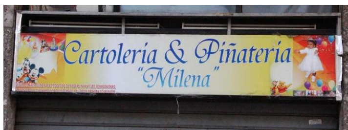
Imagen 5 Letrero de la papelería Milena Fiesta.

Tampoco faltan algunos ejemplos de formas híbridas que no se configuran como fenómenos interferenciales involuntarios, sino que parecen, más bien, el resultado de la voluntad deliberada de acercar lenguas y culturas. En la Imagen 5, por ejemplo, la denominación “Cartolería & Piñatería” une las dos lenguas en una creación novedosa, al combinar la palabra italiana, más ‘neutra’, con la española (de origen italiano, por cierto), representativa de la comunidad: una piñatería es, en el Perú sobre todo, una tienda especializada en todos los artículos aptos para las fiestas, cuyo alcance identitario ya ha sido recalcado. A pesar de los valores simbólicos asociados, siguiendo las indicaciones del párrafo anterior, no podemos hablar en este caso de translanguaging : no se trata de mensajes simultáneos en lenguas diferentes, dirigidos a destinatarios diversos, sino de una creación única.