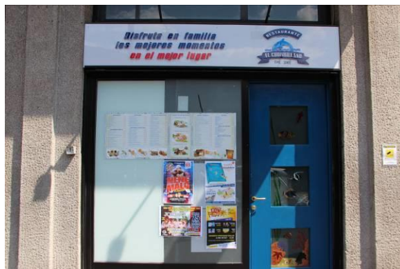
Imagen 10 La unidad principal del restaurante.

La unidad principal (Imagen 10) presenta un marco muy sencillo, que comprende tres bloques principales de signos: 1) el letrero, en la parte superior; 2) el menú, situado en el escaparate de la izquierda; 3) cuatro anuncios de eventos, debajo del menú. Al lado se evidencia el color azul chillón de la puerta de entrada, con algunos dibujos de temas marinos. En su conjunto, se puede clasificar como ejemplo de translanguaging , al utilizar deliberadamente lenguas distintas para dirigirse a destinatarios distintos.