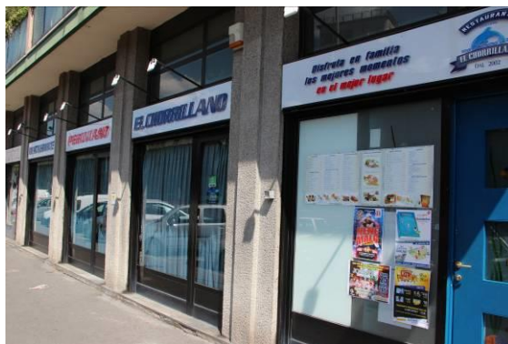
Imagen 9 El restaurante El Chorrillano.

La unidad ocupa una porción bastante amplia del espacio público, y comprende cuatro subunidades (Imagen 9): la unidad principal, que se analizará a continuación, y otras tres unidades menores. Estas comprenden, además de dos pegatinas publicitarias de escaso interés, los respectivos letreros, en los que se lee, de izquierda a derecha: RESTAURANTE; PERUVIANO; EL CHORRILLANO. 13 Llama la atención la forma italiana peruviano , en lugar del equivalente ‘peruano’, que se combina con el término español “restaurante” y el nombre propio del mismo. Tenemos entonces un ejemplo de hibridación, que funciona aquí como indicio contextualizador (Gumperz 1982), que establece las diferentes escalas del marco interaccional, desde una dimensión local, en la que la identidad nacional no se da por asumida sino que se tiene que negociar ( peruviano ), a una geografía periférica, que tiene en el gentilicio Chorrillano (de Chorrillos, un distrito mariner de la provincia de Lima) su proyección transnacional.