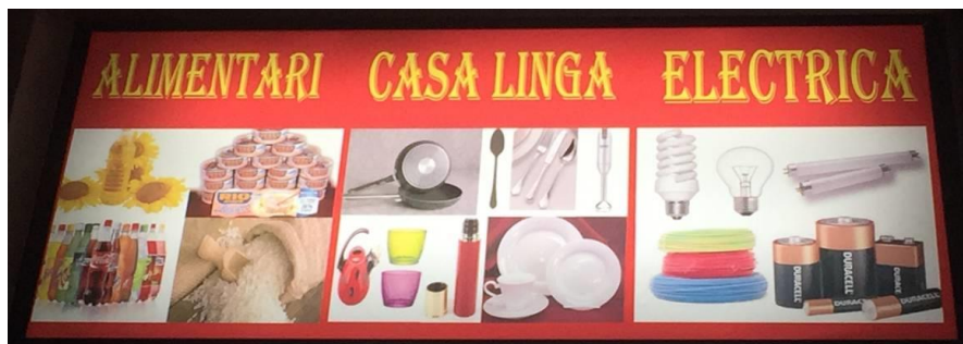
Imagen 8 Letrero de una tienda de alimentos y artículos para el hogar.

depender de razones prácticas y comerciales, es decir, de la voluntad de acercarse, de forma culturalmente neutral, al mayor número de destinatarios. El italiano que se emplea, sin embargo, es a menudo un italiano de contacto, con formas no normativas, como se ve en la Imagen 8, en la que leemos casalinga en lugar de casalinghi (‘ama de casa’ y ‘artículos para el hogar’, respectivamente); y electricica en lugar de elettricista .