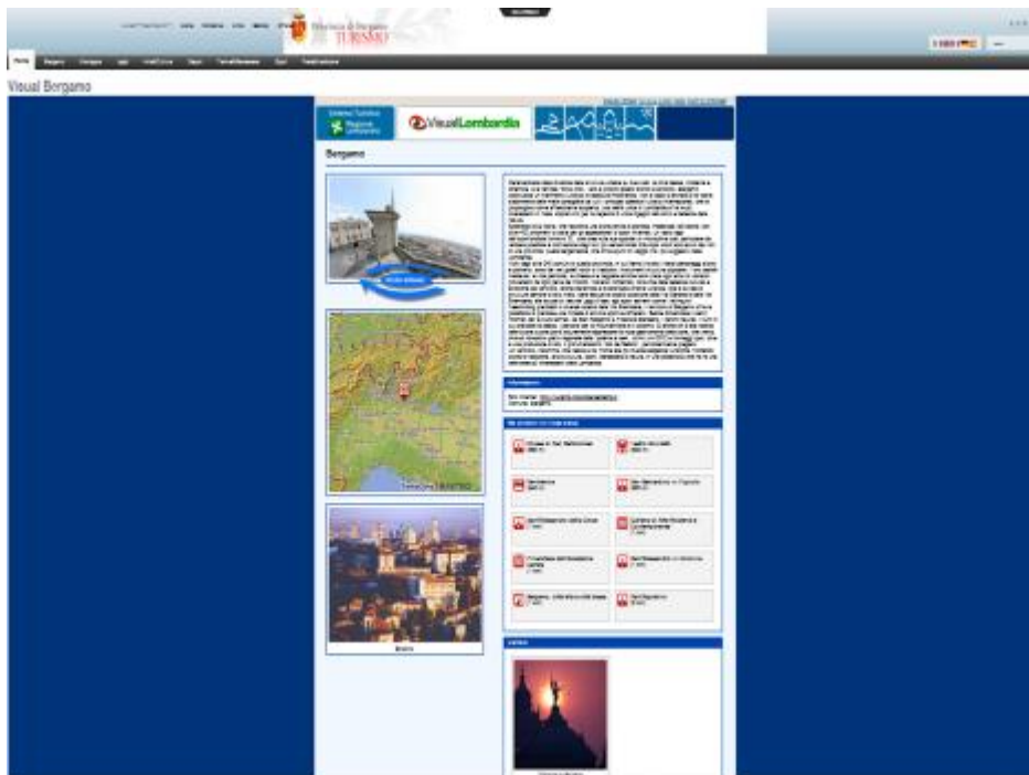
Fig. 3. La sezione "Turismo" del sito della Provincia di Bergamo

Caratterizzata dalla divisione della struttura urbana su due livelli, la città bassa, moderna e dinamica, e la famosa "Città Alta", vero e proprio gioiello storico e artistico, Bergamo costituisce un riferimento turistico di assoluta importanza (Provincia di Bergamo).