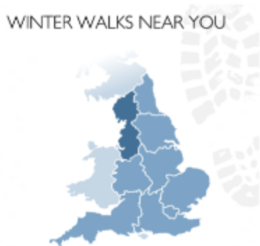
Figura 2: Esempio di cartina interattiva dell'Inghilterra (sito di English Heritage )

Quanto all'organizzazione dei siti, in generale l'architettura user-friendly dell'informazione facilita la 'trovabilità' (Rosati 2007) di quanto cercato, che è raggiungibile attraverso percorsi plurimi. Appaiono sfruttate appieno le caratteristiche peculiari del Web 2.0, cioè l'intertestualità, la multimedialità (ad es. per le suggestive sequenze fotografiche) e soprattutto l'interattività, grazie anche all'integrazione dei locative media con la pagina web. Le tecnologie della localizzazione permettono all'utente di esplorare il territorio in modo customizzato, generando secondo le preferenze indicate una mappa del luogo d'interesse e una sua breve descrizione con la possibilità di costruirsi itinerari ad hoc . Una cartina interattiva dell'Inghilterra, suddivisa nelle varie regioni, può così illustrare i "winter walks near you". Analogamente, cliccando il calendario interattivo sulla data desiderata appare l'elenco dei relativi eventi, ciascuno dotato di link descrittivo comprensivo di prezzi e modalità di partecipazione.