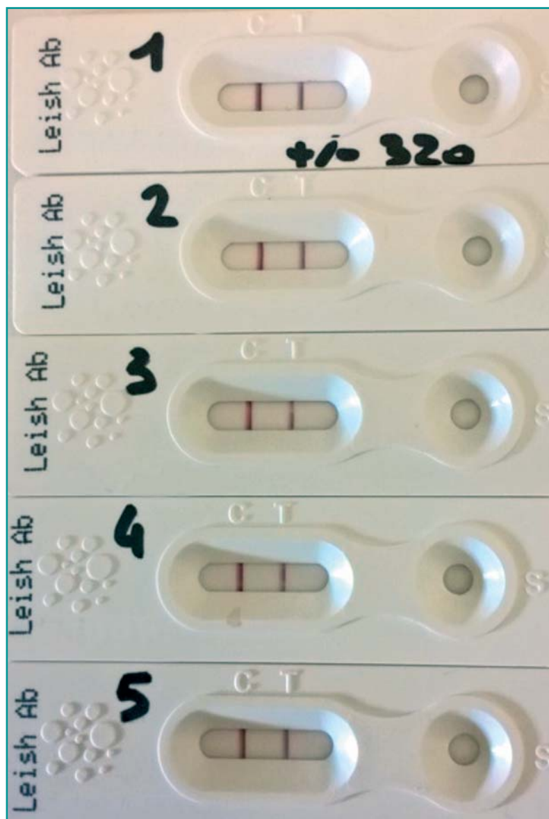
Figura 2 - Prova di ripetibilità con metodo immunocromatografico Theratest Leishmania ® per la ricerca di anticorpi verso Leishmania infantum : lo stesso campione ripetuto ha sempre mostrato il medesimo risultato positivo.

una specificità del 95% (95% IC 75,13%-99,87%) con un valore predittivo positivo (VPP) del 84,94% (95% IC 54,86-98,20) e un valore predittivo negativo (VPN) del 100% (95% IC 90,50-100,00). Il valore del kappa statistico ( \kappa ), calcolato per valutare la concordanza oltre al caso dei due metodi nell'individuare anticorpi anti Leishmania nei campioni analizzati è risultato di 0,935 indicando un ottimo accordo tra i due test. Nessuno dei