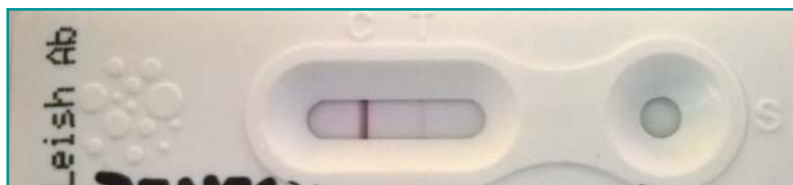
Figura 1 - Valutazione della positività per la ricerca di anticorpi verso Leishmania infantum con metodo immunocromatografico Theratest Leishmania ® : campione con titolo di positività IFAT 1:80 risultato positivo al test immunocromatografico con una colorazione della linea del risultato molto tenue.

Utilizzando il metodo IFAT come riferimento il test immunocromatografico ha evidenziato una sensibilità del 100% (95%IC 88,43%-100,00%) e una specificità del 95% (95% IC 75,13%-99,87%) e un valore K di 0,935 indicando un ottimo accordo tra i due test.