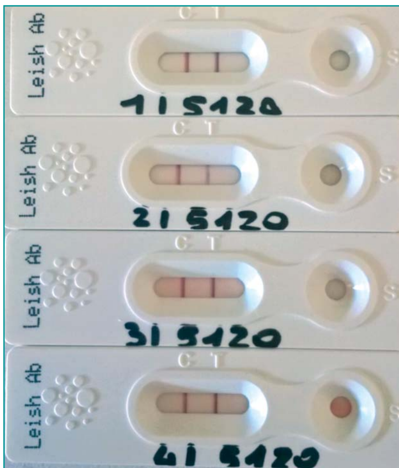
Figura 3 - Prova di ripetibilità con metodo immunocromatografico Theratest Leishmania® per la ricerca di anticorpi verso Leishmania infantum : un campione positivo al test IFAT con titolo 1:2560 alla prova di ripetibilità ha evidenziato una forte variabilità nell'intensità della linea di positività.

SA presenta sensibilità e specificità variabili in base al differente antigene impiegato 23 . I metodi quantitativi, oltre a confermare l'infezione, permettono la valuta-