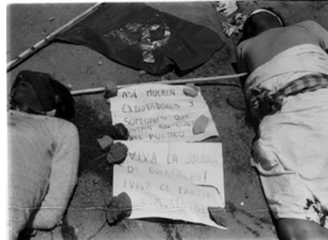
Foto 4: Matanzas en Ayacucho, documentos originales de la época utilizados en el documental, procedentes de los archivos del GEIN.