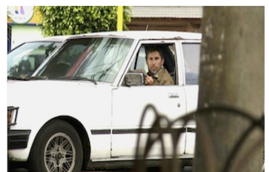
Foto 2 y 3: Algunos fotogramas originales del documental. Reconstrucción de operativos de Sendero Luminoso en las calles limeñas y el seguimiento del grupo del GEIN.