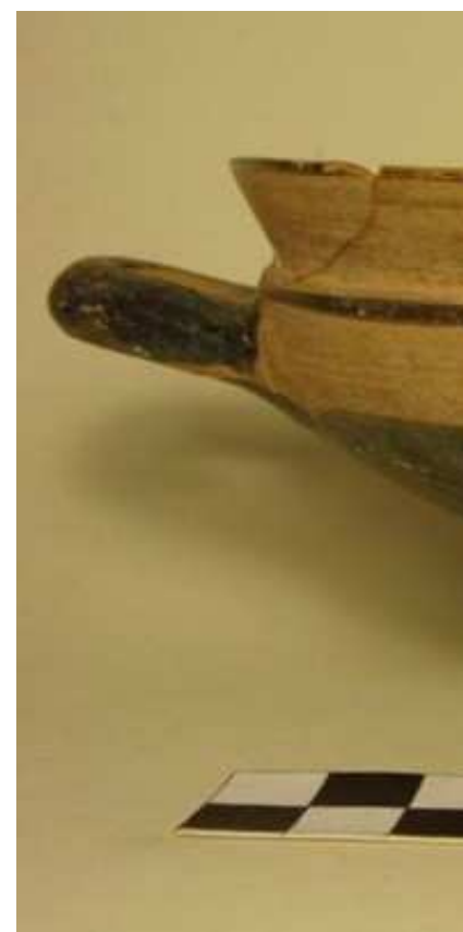
Figg. 05-06. C