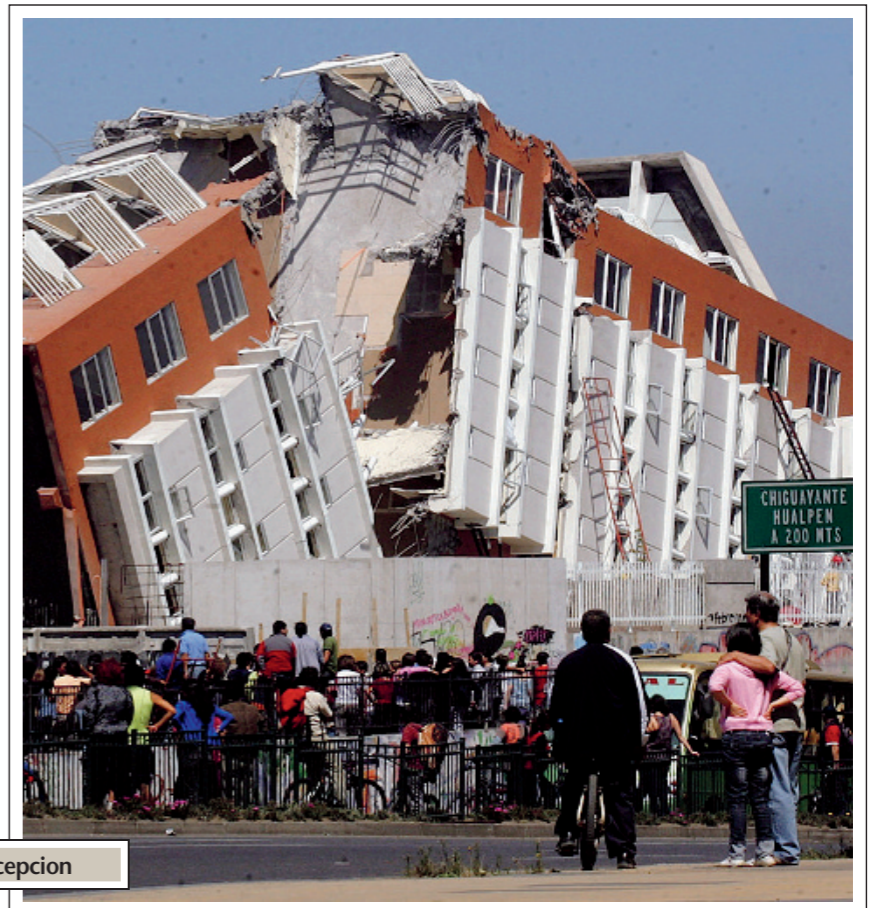
Un palazzo crollato per il sisma a Concepcion