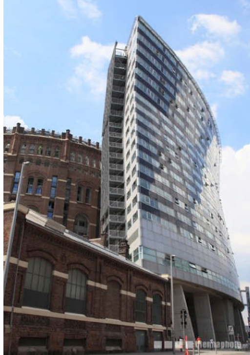
Fig. 1.1: Gasometer B di Coop Himmelb(l)au a Vienna

europeo di architettura "Ugo Rivolta" 5 del 2007 può essere validamente preso ad esempio per tradurre, e poi rielaborare, indicazioni valide a orientare edilizia e urbanistica anche nelle trasformazioni che attraversano il territorio trentino e le aspettative dei giovani del nostro tempo.