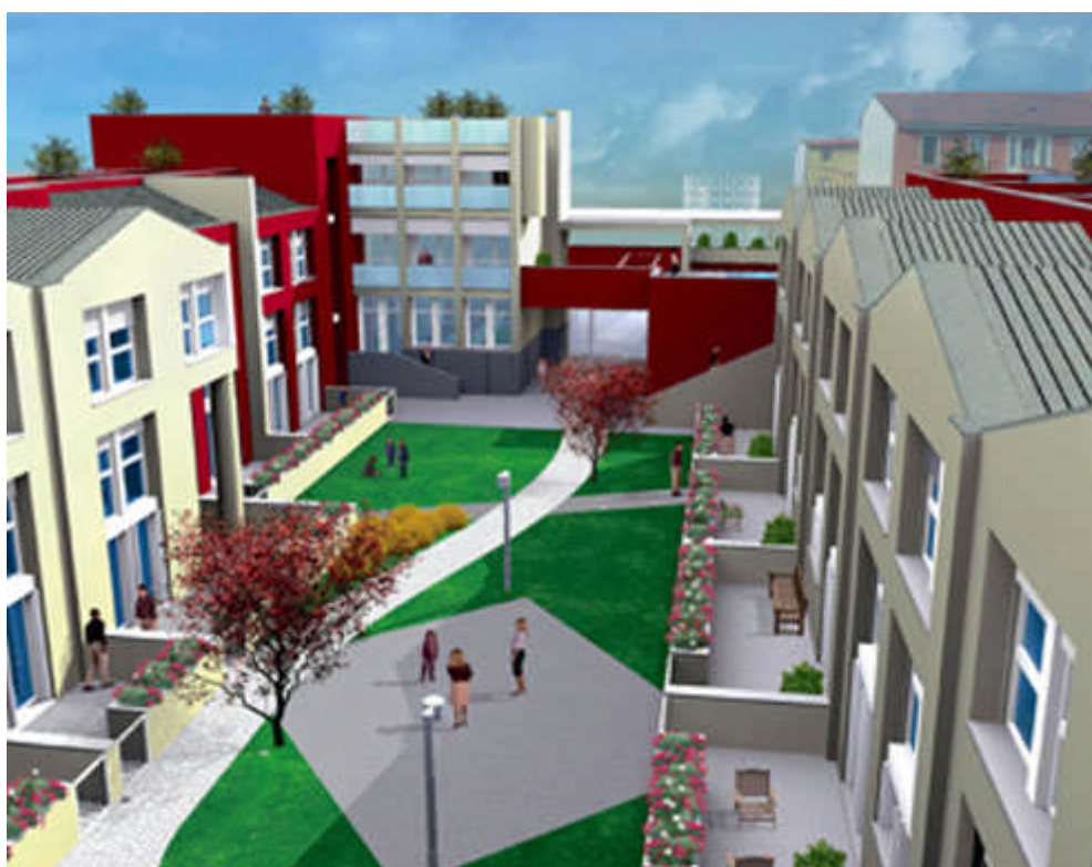
Fig. 1.6: L'Urban Village Bovisa 01 a Milano

Le motivazioni che portano alla coresidenza sono l'aspirazione a ritrovare dimensioni perdute di socialità, di aiuto reciproco e di buon vicinato e contemporaneamente il desiderio di ridurre la complessità della vita, dello stress e dei costi di gestione delle attività quotidiane.