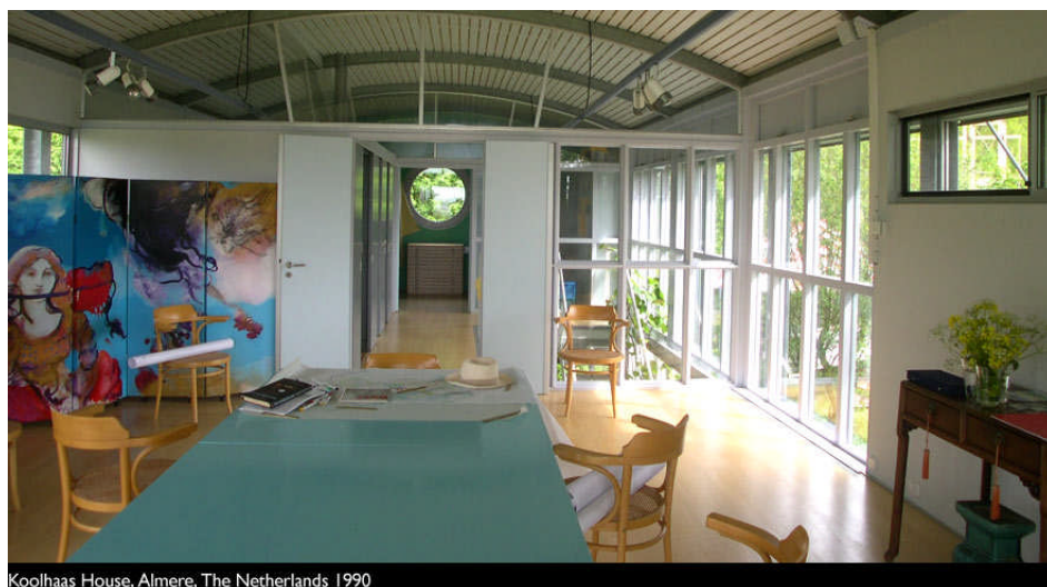
Fig. 1.8: La casa singola provvisoria ad Almere

Dar vita a un edificio residenziale flessibile significa non solo individuare le esigenze degli utenti in termini di evolutività dell'alloggio, sostiene Malighetti (2000), ma anche saper effettuare una lettura dell'ambito culturale e produttivo dal quale il progetto nasce e saperne, altresì, accompagnare il processo edilizio che necessariamente deve coinvolgere committenti, progettisti, imprese appaltatrici e fruitori. In figura 1.7 e 1.8 è visibile la "Casa singola provvisoria", un progetto sempre di Teun Koolhaas ad Almere che mostra un alloggio completamente costruito con componenti prefabbricati che si caratterizza per una estrema semplicità e luminosità ottenuta grazie alle grandi pareti vetrate.