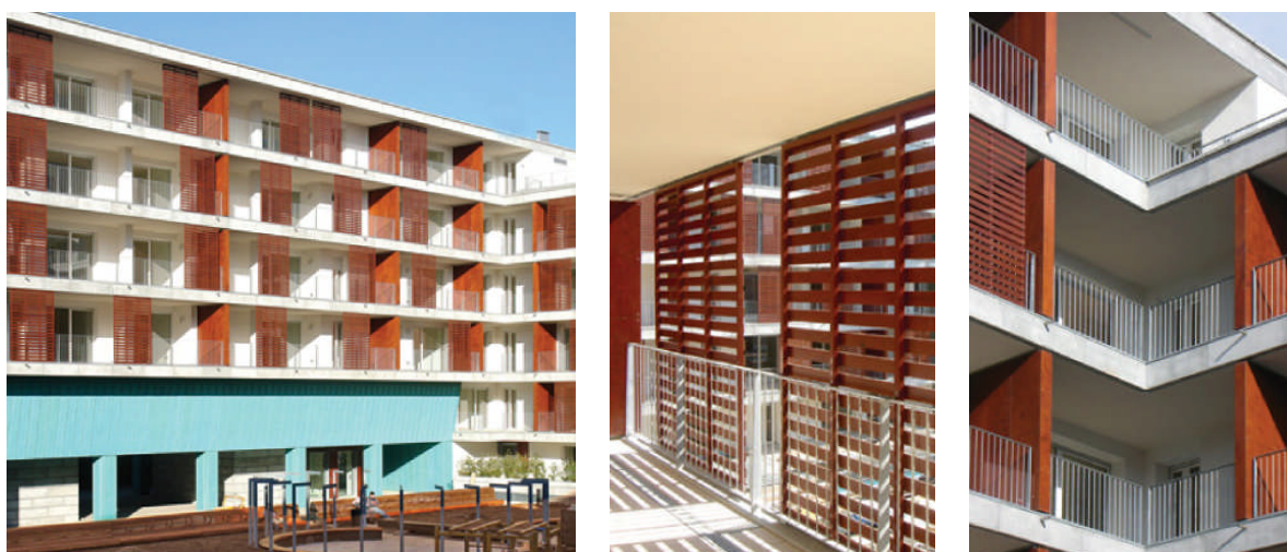
Fig. 1.5: Il complesso Resia 1 a Bolzano