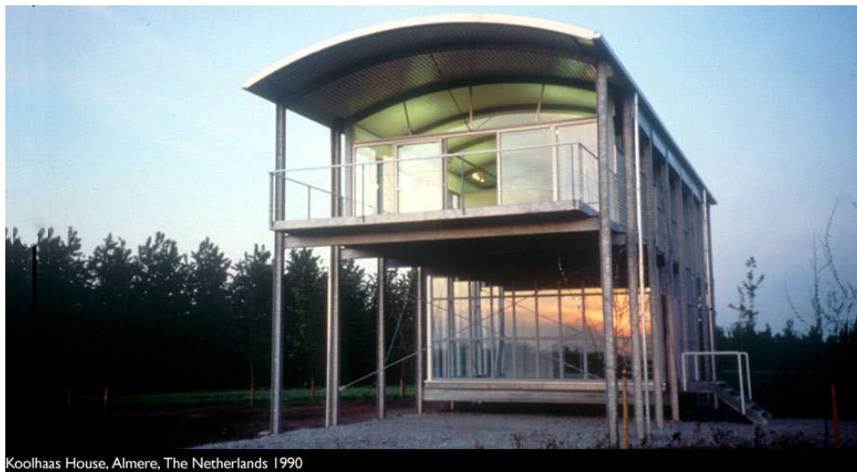
Fig. 1.7: La casa singola provvisoria ad Almere

Dar vita a un edificio residenziale flessibile significa non solo individuare le esigenze degli utenti in termini di evolutività dell'alloggio, sostiene Malighetti (2000), ma anche saper effettuare una lettura dell'ambito culturale e produttivo dal quale il progetto nasce e saperne, altresì, accompagnare il processo edilizio che necessariamente deve coinvolgere committenti, progettisti, imprese appaltatrici e fruitori. In figura 1.7 e 1.8 è visibile la "Casa singola provvisoria", un progetto sempre di Teun Koolhaas ad Almere che mostra un alloggio completamente costruito con componenti prefabbricati che si caratterizza per una estrema semplicità e luminosità ottenuta grazie alle grandi pareti vetrate.