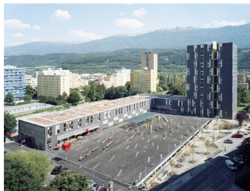
Fig. 1.3: Il complesso Centrum Odorf a Innsbruck