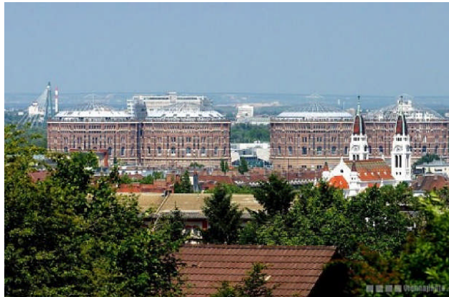
Fig. 1.2: Vista dei Gasometer Simmering a Vienna

progettisti Jean Nouvel, Manfred Wehdorn, Wilhelm Holzbauer e Coop Himmelb(l)au si sono occupati della riconversione, connettendo l'area con il centro città e creando circa 620 appartamenti, uffici e negozi. La maggior parte di queste nuove unità abitative sono state sovvenzionate all'interno del programma viennese di housing sociale, così come nell'edificio "Gasometer B" , che ospita un ostello per studenti della capacità di 250 posti, in figura 1.1.