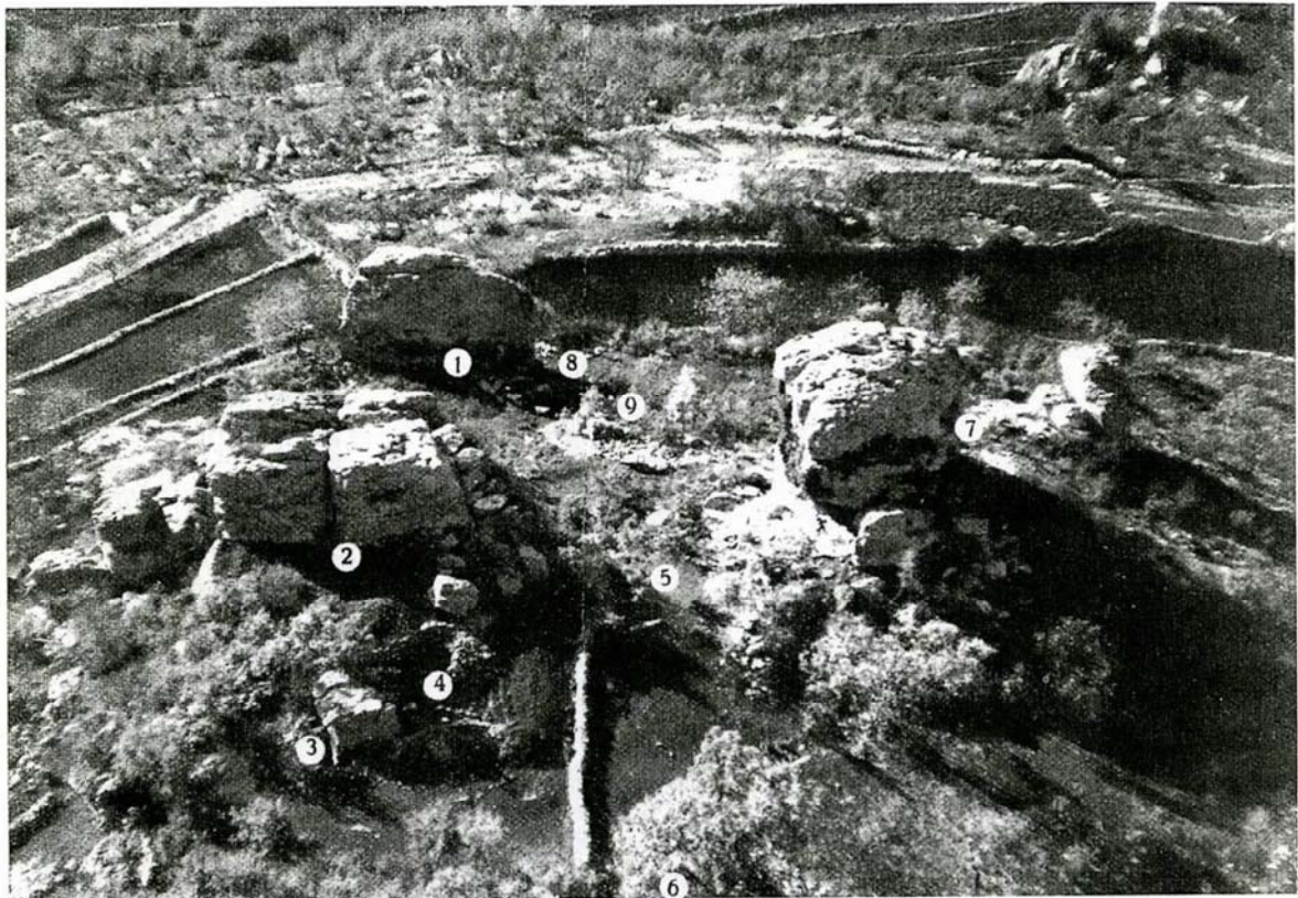
Fig. 1. Veduta aerea dell'area sondata durante gli scavi Zorzi con indicazione numerica dei sondaggi (ZORZI 1960, p. 104).

Aerial view of the digging areas of Zorzi's excavations with the numbering of the trenches (ZORZI 1960, p. 104).