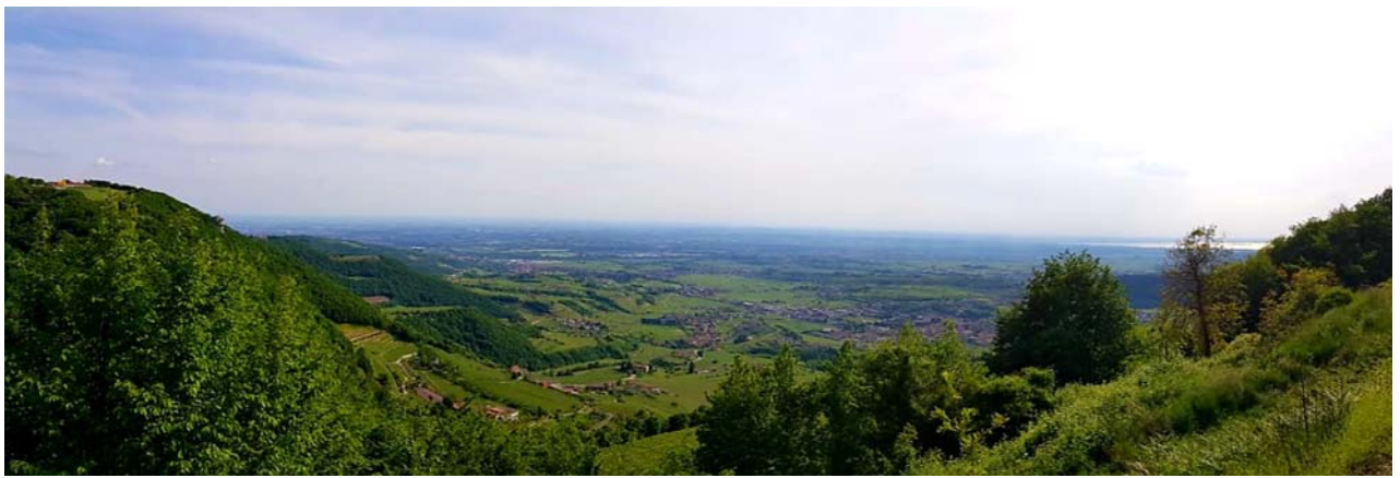
Fig. 3. Panoramica (ripresa da Nord) della valle a sud dell'abitato con il Lago di Garda che si intravede in direzione sud-ovest.

Overview (shot from the North) of the valley located south of the site. Lake Garda could be glimpsed looking south-west.