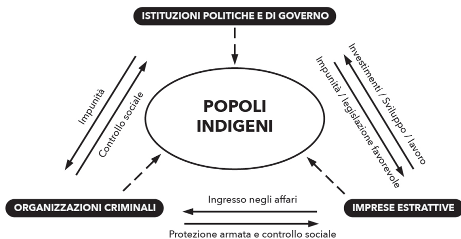
Figura 2. La pressione sui popoli indigeni degli attori istituzionali, economici e criminali attivi nel contesto estrattivista.

Nel contesto estrattivista, la questione della tutela dei diritti umani dei popoli indigeni trova nuova enfasi a causa della pressione esercitata da attori politico-istituzionali, economici e criminali sui territori e sulle terre da loro abitate.