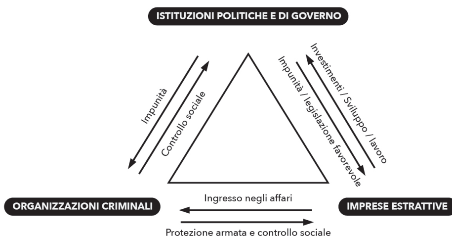
Figura 1. Il sistema estrattivista in Messico: relazioni e mutui benefici tra attori istituzionali, economici e criminali.

In alcuni contesti i narcotrafficanti, a volte d'accordo con i datori di lavoro, impongono ai lavoratori una sorta di «tassa di collaborazione» per avere il diritto di lavorare in miniera, mentre alle comunità interessate viene imposta una tassa per recuperare le royalties, che le miniere sono obbligate a pagare ai municipi in cui si stabiliscono (Hernández Navarro 2017). I gruppi criminali paramilitari messicani non si sono però limitati a collaborare con le imprese: essi si sono autonomamente inseriti nel mercato, divenendo veri e propri operatori economici attraverso l'esercizio della violenza e grazie alla loro «capacità di porre il delitto a fondamento di un agire di tipo imprenditoriale» 16 . Estorsioni ai proprietari terrieri che affittano i terreni alle miniere; estorsioni ai lavoratori delle stesse; sequestri, sparizioni forzate e omicidi ai danni di imprenditori e impiegati delle imprese; installazione di miniere illegali; furto e rivendita di minerali e idrocarburi sono solo alcune delle modalità mediante le quali i gruppi criminali messicani si sono trasformati in attori economici competitivi e concorrenti a quelli legali.