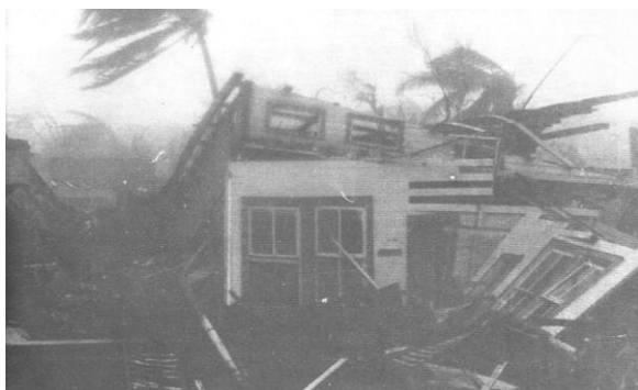
Figura 6: Paso del huracán Juana en Cane Creek (RACCS).

No hay que olvidar el lazo espiritual que las comunidades indígenas mantienen con la naturaleza. Refiriéndose a la lírica miskitu, Saavedra Areas y Fagoth enfatizan lo siguiente: