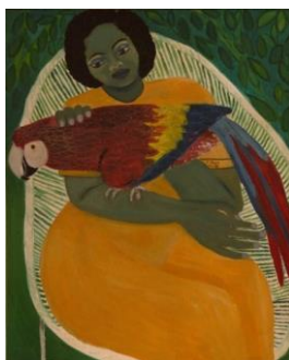
Figura 2: June Beer Thompson, Sin título, 1984 8

En 2005, cuando trabajaba en su tesis de maestría, Rossman recorrió toda la costa caribeña de su país en busca de escritoras. Así descubrió que gozaban de reconocimiento en sus comunidades; tal era el caso de June Beer Thompson (1935-1986) o Isabel Estrada Colindres (1953). Sin embargo, en general, sus escrituras quedaban fuera del circuito editorial, no solo de Nicaragua sino también de Centroamérica. La mayoría de estas mujeres mantenía sus poemas resguardados en páginas sueltas y, aquellas que habían sido publicadas, aparecían casi exclusivamente en muestras, ya sea en revistas o antologías. Casi ninguna había publicado un libro de su autoría, tendencia que se mantiene hasta hoy. Por ejemplo, todavía no existe una recopilación completa de la obra escrita de Beer Thompson, quien además fue una reconocida artista, tanto en la región del Caribe como en la del Pacífico.