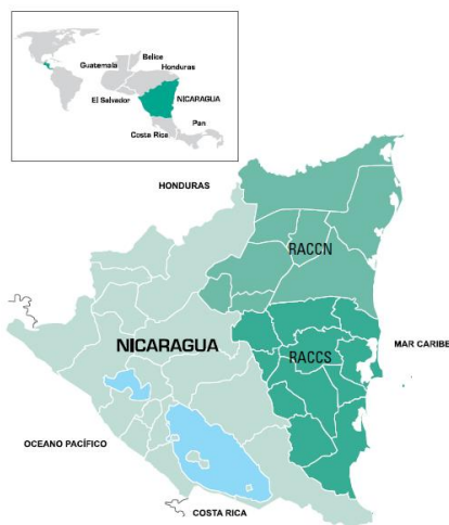
Figura 1: Las Regiones Autónomas de la Costa Caribe

Nicaragua es uno de los siete países que conforman el istmo centroamericano. Al norte limita con Honduras y al sur, con Costa Rica. Las aguas del mar Caribe y del Océano Pacífico bañan sus costas. Su extensión territorial es de poco más de 130 mil km 2 y, para su administración, el país está dividido en quince Departamentos y dos Regiones Autónomas, estas dos últimas conocidas como la Costa Caribe; sus nombres oficiales son la Región Autónoma de la Costa Caribe Norte (RACCN) y la Región Autónoma de la Costa Caribe Sur (RACCS). 2 En conjunto, ambas abarcan poco más de 60 mil km 2 , es decir, casi la mitad del territorio nacional.