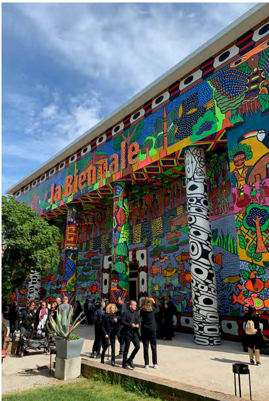
1. MAHKU (Movimento dos Artistas Huni Kuin), Kapewë Pukeni (Il ponte-alligatore) , 2022, Facciata del Padiglione Centrale, Venezia, 60. Biennale Arte