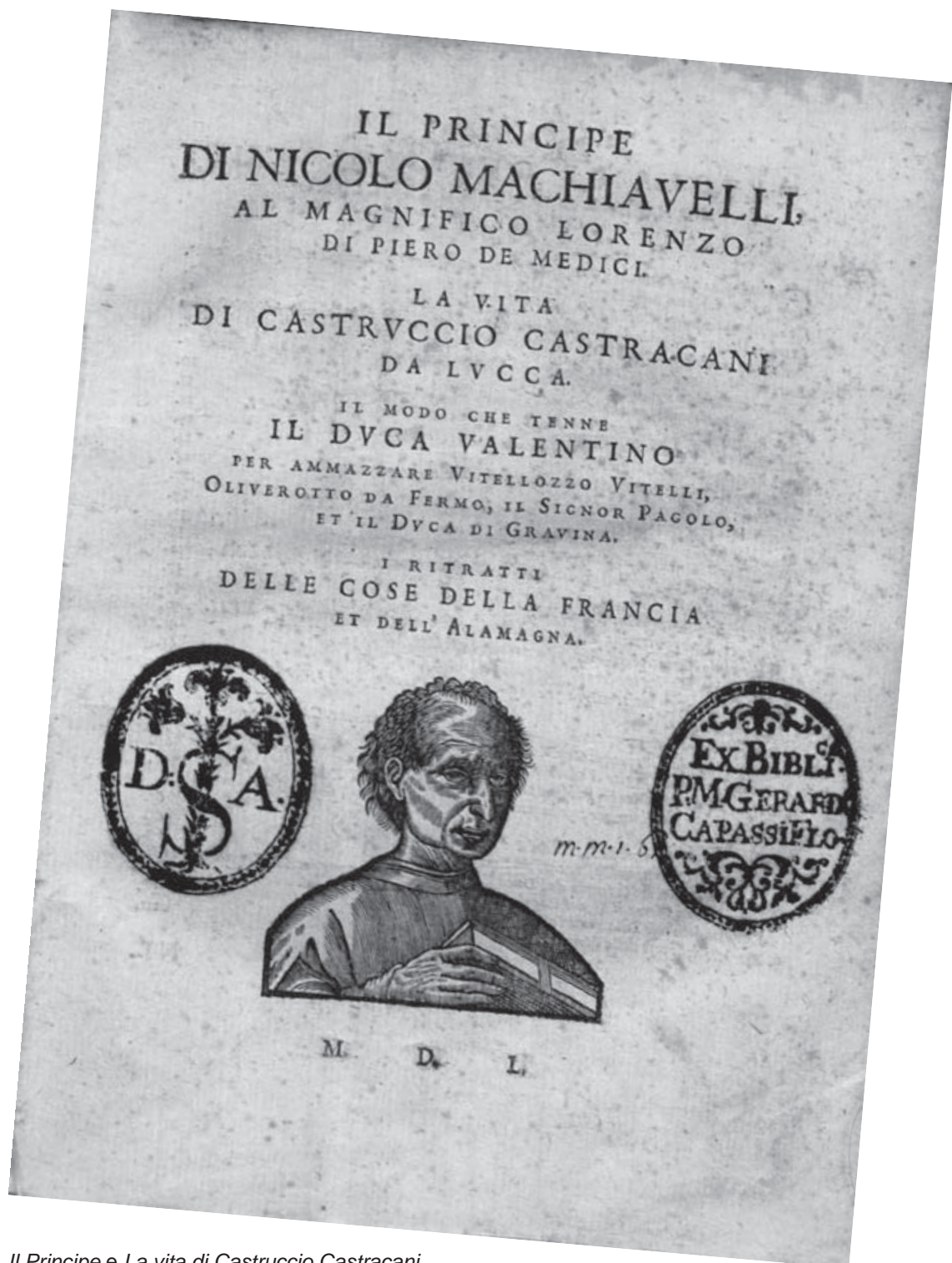
Il Principe e La vita di Castruccio Castracani di Niccolò Machiavelli nell'edizione del 1550