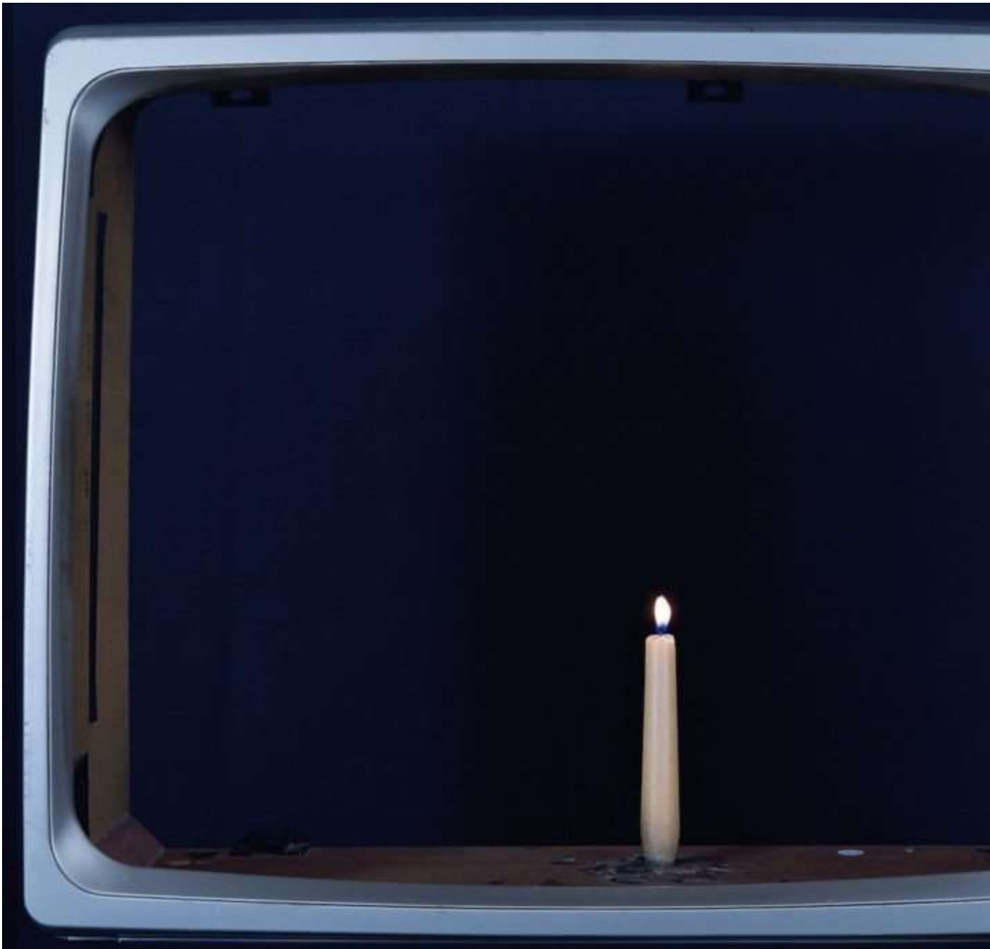
Nam June Paik (1932 – 2006), Televisore , 1990. Scocca televisore, candela | shell of TV, candle collezione Cozzani | Cozzani collection, CAMEC (SP).

Appropriato l'accostamento di Paik con Giacomo Verde che proprio in quegli anni (fine anni Ottanta) stava lavorando a una dimensione critica della televisione, con interventi proprio sull'oggetto TV: la dimensione ludica, non estranea a entrambi gli artisti, sia pur distanti, li porta a giocare con lo schermo, a usarlo in modo creativo o a distruggerlo, a farne dei pezzi di un impossibile puzzle. Contribuisce a questo accostamento anche l'installazione di Verde della Tv scafandro di AnTVrus(h) (1990-1992), vicino al Paik che "abusa", divertendosi, della tecnologia per riprodurre sculture-robot giocattolo con Li Tai Po , 1987