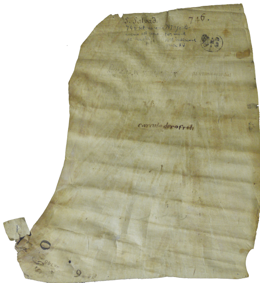
ASSi, Diplomatico San Salvatore di Monte Amiata 746 settembre - 747 agosto, casella 1, verso. Divieto di ulteriore riproduzione