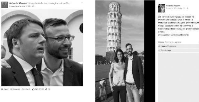
Figura 6 – Esempi di Post di Antonio Mazzeo