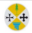
CONSIGLIO REGIONALE della CALABRIA