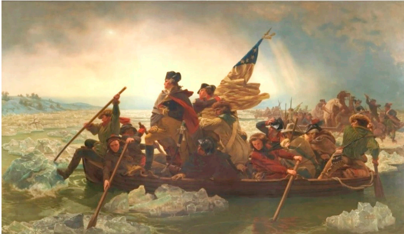
Figura 1. – Leutze, Emanuel, “Washington attraversa il fiume Delaware”, 1851, olio su tela, Metropolitan Museum of Art, New York, https://www.metmuseum.org/it/art/collection/search/11417 .

quale viene rappresentato un “momento critico” della guerra rivoluzionaria dalla quale gli Stati Uniti emergeranno come una nazione indipendente 1 .