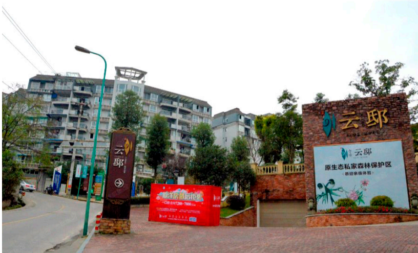
Figure 2. – Qifeng Yundi gated community entrance with advertising banners.

and private (protected) green (see Fig. 2 ). The gated community aspires to become a sacred heterotopia where human and non-human beings experience pure freedom and happiness away from the precariousness of everyday life upon a decade of politicized environmental crisis.