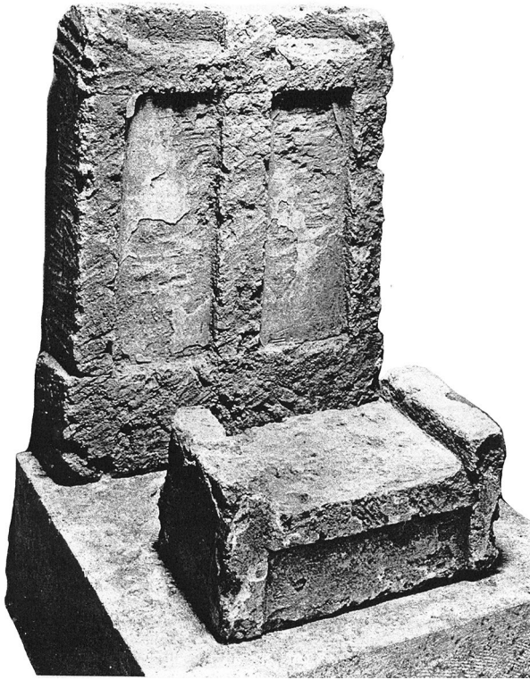
Figura 6. Estela y altar del «Santuario della Doppia Stele», Corinto, Potters' Quarter (según Tofi 2004, fig. 4).

(fig. 6), los cuales, raros en el resto del mundo griego, aparecen frecuentemente en Corinto, especialmente en el Potters' Quarter , abriéndose un abanico de interpretaciones entre las que no se puede excluir una relación con los cultos de betilos del área fenicia 50 .