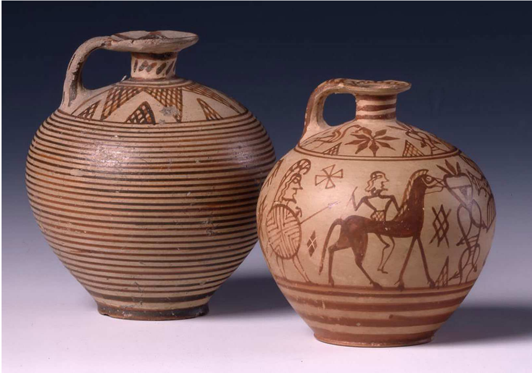
Figura 3. Aryballoi globulares protocorintios (London, British Museum).