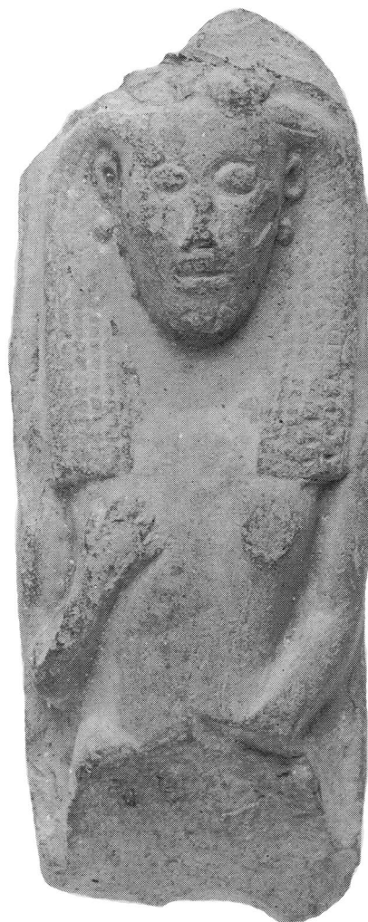
Figura 5. Placa cerámica en estilo dedálico con representación de Astarté que se toca los senos, de Corinto, segundo cuarto del siglo VII a.C. (según Merker 2003).

Para concluir, es muy importante recordar el descubrimiento realizado hace tiempo sobre los influjos culturales fenicios en Corinto en el ámbito de los cultos de la polis : por un lado, estamos haciendo referencia a la imposición progresiva a partir de la mitad del siglo VIII a. C., y en coincidencia con la decisiva apertura de la ciudad al comercio marítimo, a la presencia de un culto a Afrodita Ourania , Ôplismenē e Kypris , divinidad de la polis pero de origen no griego, sino tomada en préstamo de la Astarté de los comerciantes del norte de Siria y fenicios (fig. 5) 49 ; y, por otro lado, destacamos la discutida presencia de stele shrines , pequeños periboloi de piedra, de forma rectangular e hipetrales con estelas simples o dobles