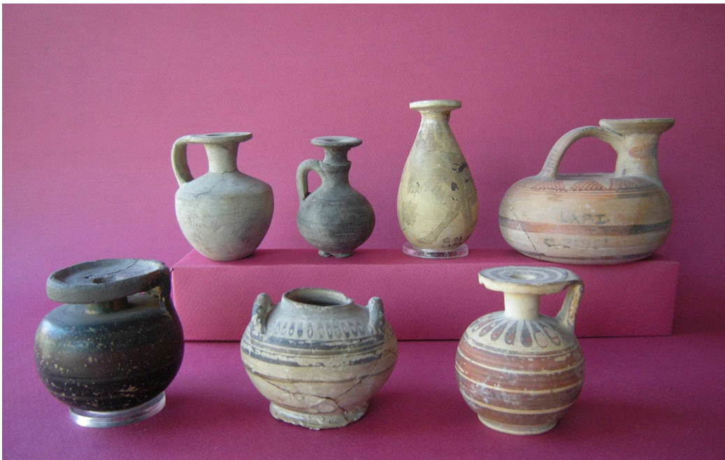
Figura 4. Gela, necrópolis de Predio La Paglia, tumba 1, segunda mitad del siglo VII – inicios del VI a.C.: set de ungüentarios, en orden (arriba, desde la izquierda) aryballoi rodios del Spaghetti Style , alabastron corintio, askòs nord-jónico (abajo, desde la izquierda) aryballos laconio, pequeña pixis corintia, aryballos de tipo protocorintio con el fondo plano. Gela, Museo Archeologico Regionale (según Lambrugo 2013, Tav. 12).