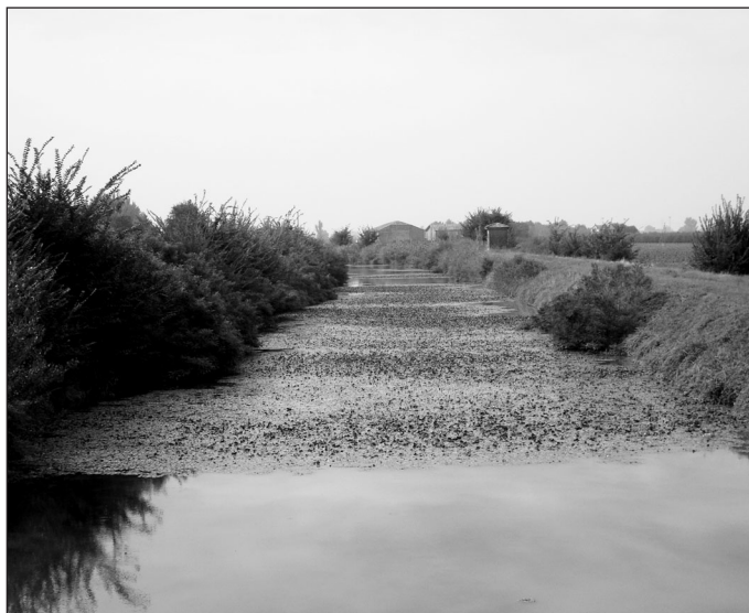
Fig. 6 – Popolazione di Trapa natans sul Diversivo di Burana: in anni favorevoli essa copre oltre 1,5 km di lunghezza (settembre 2011)