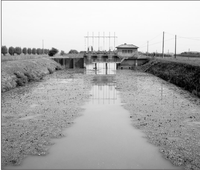
Fig. 7 – Popolazione di Trapa natans nel Diversivo di Burana al sostegno Canaletto: come si vede, le acque libere sono soltanto una piccola fascia centrale (settembre 2011)

Infine, il problema delle specie alloctone invasive erbivore ( Myocastor coypus e Procambarus clarkii ), già ampiamente dibattuto (es. Ferri & Sala, 1992; Tongiorgi et al. , 1998; Geiger et al. , 2005; Quaglio, 2006; Galende et al. , 2013), merita un rapido cenno, perché in molti casi proprio a queste spetta la responsabilità della rapidissima scomparsa di popolazioni anche estese e floride. Molto spesso gli habitat colonizzati da M. coypus e P. clarkii sono pressoché privi di vegetazione: il fenomeno è stato osservato non solo nel Modenese, ma anche ad esempio in provincia di Mantova (Simoncelli & Accordi, in verbis ) e in provincia di Ferrara (Piccoli et al. , 2014). Certe specie particolarmente appetite, quali Nuphar lutea , Nymphaea alba , Nymphoides peltata e Trapa natans (Scaravelli, 2002; Prigioni et al. , 2005), hanno subito un vero e proprio tracollo e in molti luoghi sono scomparse. Il problema è ben noto a livello nazionale, tanto che M. coypus dal 2014 è dichiarata specie nociva cacciabile (legge 116/2014), mentre per P. clarkii non esistono ancora provvedimenti legislativi.