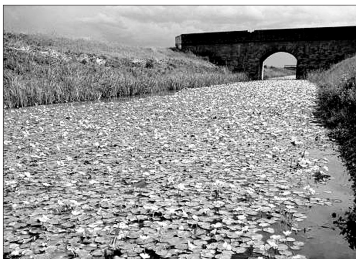
Fig. 4 – Massiccia popolazione di Nymphaoides peltata sulla Fossa di Confine, a Porcara di Sermide (primi anni del XXI sec.)