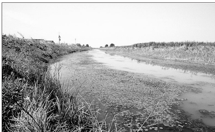
Fig. 3 – Massiccia popolazione di Marsilea quadrifolia sulle sponde del Cavo di Sopra, nelle Valli di Mirandola (estate 2001, foto D. Dallai)

peraltro che in due soli casi, in tutta l'area di studio, la popolazione è veramente rigogliosa ed estesa (1,5-2 km): si tratta di N. alba nel canale di Fossalta (Felonica Po), che beneficia tutto l'anno di un livello d'acqua pari ad almeno 80 cm (Fig. 5), e di Trapa natans sul Diversivo di Burana (Finale Emilia), in cui, come detto, il livello dell'acqua non scende mai sotto i 120 cm (Fig. 6).