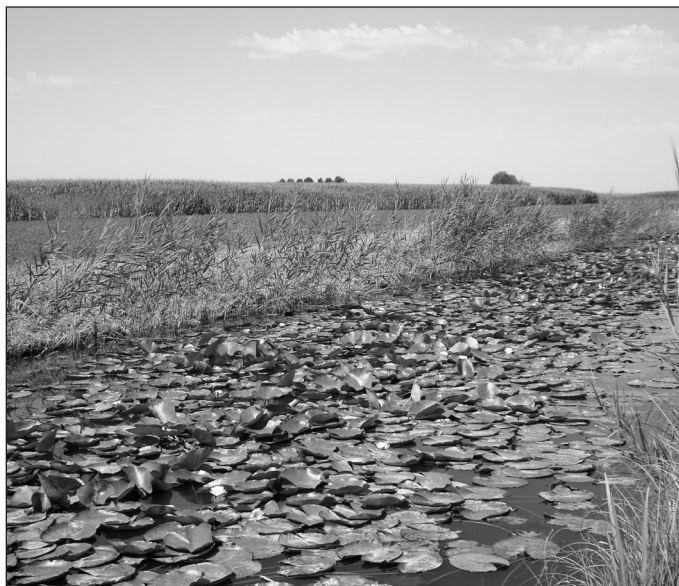
Fig. 5 – Popolazione di Nymphaea alba sul canale di Fossalta: le piante, eccezionalmente rigogliose, coprono l'intera superficie del canale per un tratto di circa 2 km (luglio 2014, foto F. Buldrini)