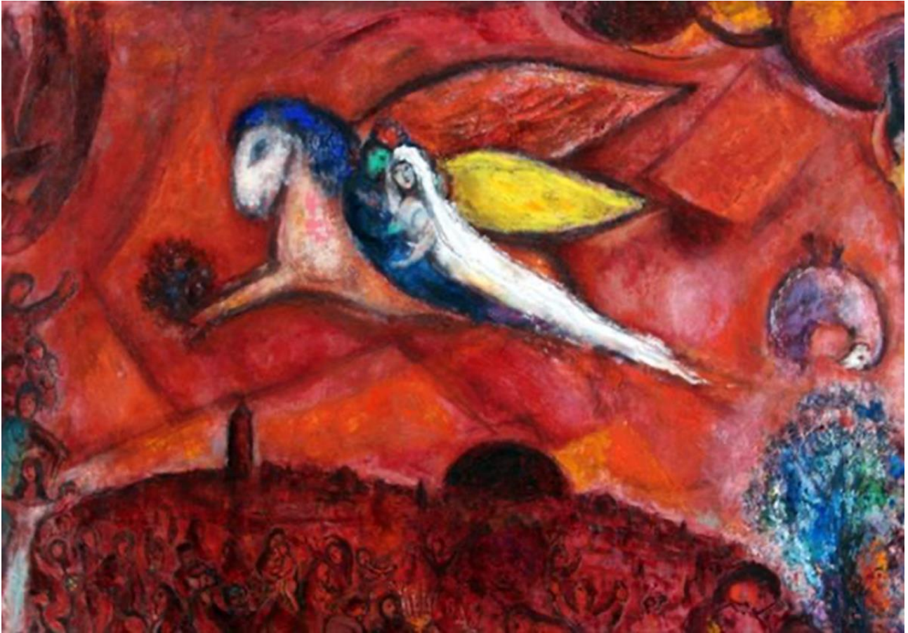
Marc Chagall (Lézna, 7 luglio 1887 - Saint Paul de Vence, 28 marzo 1985), Cantico dei Cantici IV , olio su carta incollata su tela, 1958.

La risposta può essere trovata in un testo biblico che ha goduto per tutto il Medioevo di una straordinaria fortuna esegetica: il Cantico dei Cantici . L'epitalamio attribuito a Salomone si offriva all'immaginazione medievale come il racconto in versi di un'avventura erotica, interpretata certo in chiave allegorica o tropologica o mariologica, ma senza che ciò comportasse l'eliminazione della sensualità della lettera.