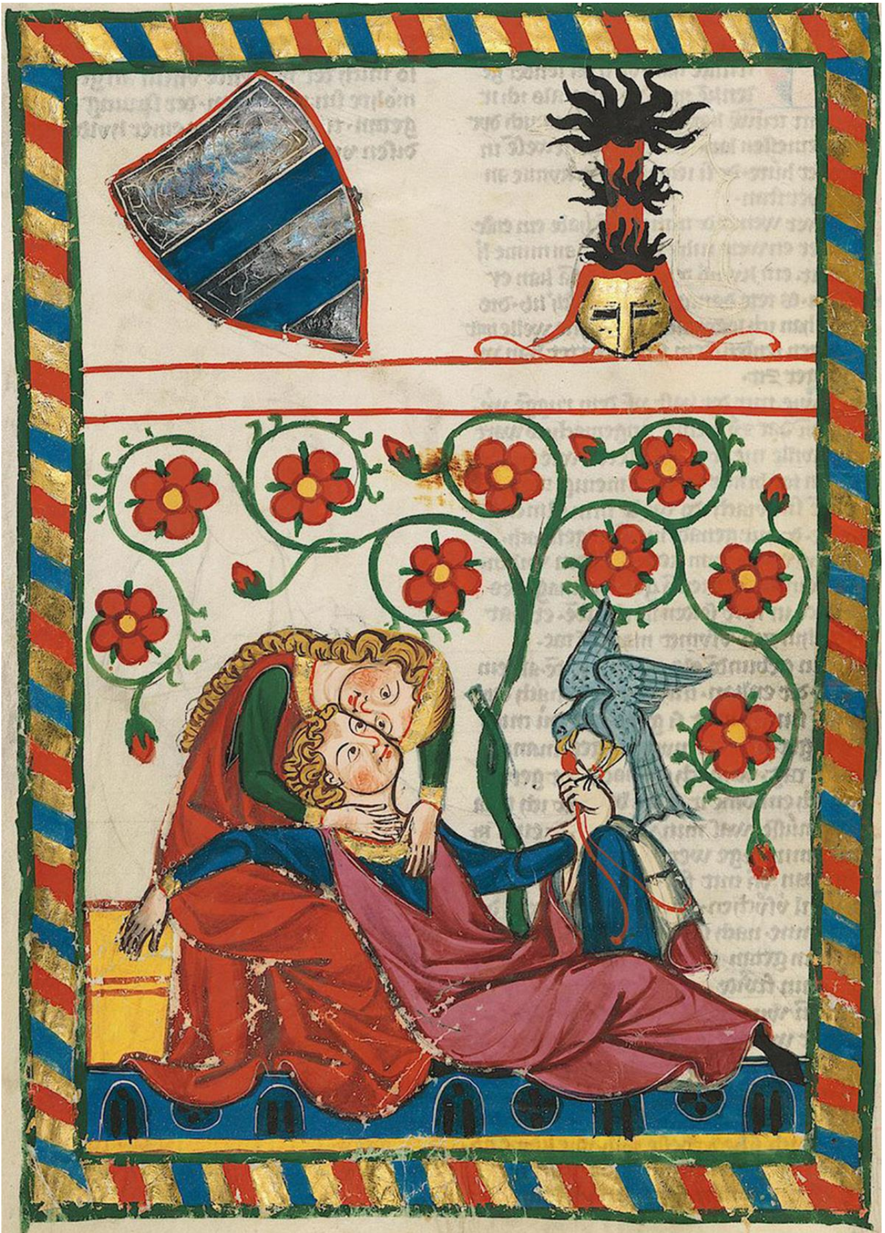
Universitätsbibliothek Heidelberg, ms. Cod. Pal. germ. 848 (Codice Manesse), f. 249v.