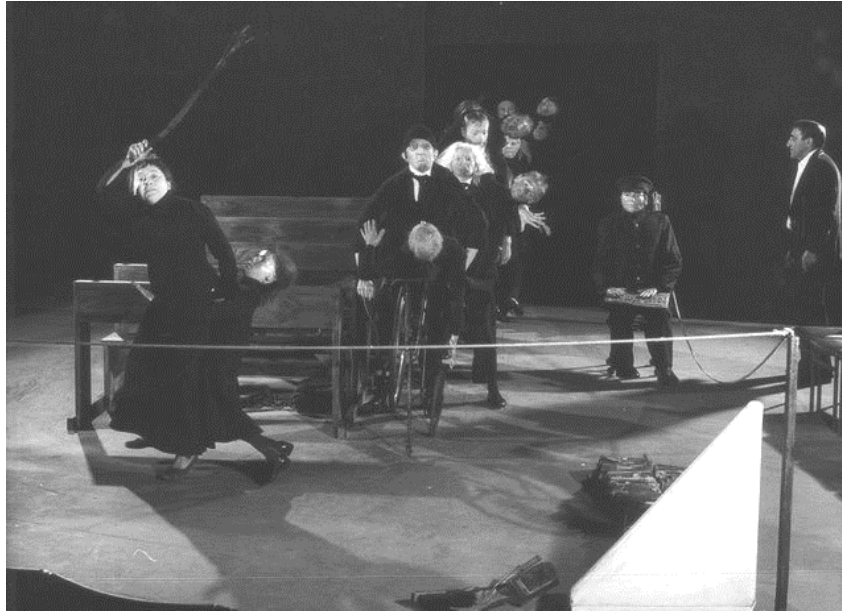
Figura 1 – T. Kantor, La classe morta , ingresso e processione dei «bio-oggetti».

Più che accompagnare i rispettivi alter ego , Kantor vuole che i manichini «facciano corpo» 10 con loro, e l'espressione va intesa in senso letterale: vecchi e giovani, fantocci e persone in carne e ossa danno vita a un'unità che rende impossibile distinguere e separare gli uni dalle altre. Decisivo è il fatto che i manichini diano l'impressione di essere «escrescenze parassitarie e ipertrofiche» 11 degli esseri umani: gli attori non si limitano a trasportare i bambini, ma sono essi stessi questi bambini. La posta in gioco è alta, perché a essere chiamata in causa è qui un'immagine che in nulla si distingue dal proprio referente: non un doppio, non un "altro", ma addirittura lo "stesso". I manichini sono «una specie di prolungamento immateriale, qualcosa come un organo complementare dell'attore, che ne era il 'proprietario'» 12 : bio-oggetti, appunto, espressione ossimorica che rende evidente la volontà di fondere insieme due sfere incongruenti, quella della realtà cosale, inorgani-