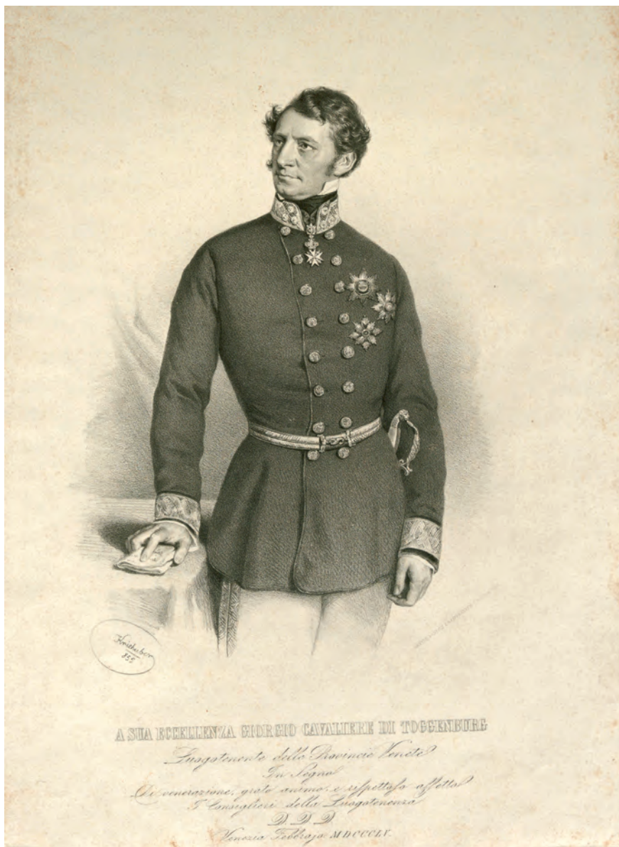
Fig. 3. Josef Kriehuber (litografo), A Sua Eccellenza Giorgio cavaliere di Toggenburg, Luogotenente delle Provincie Venete , litografia, 1855, su concessione del Wien Museum, Inv.-Nr. W 6520, CC0.