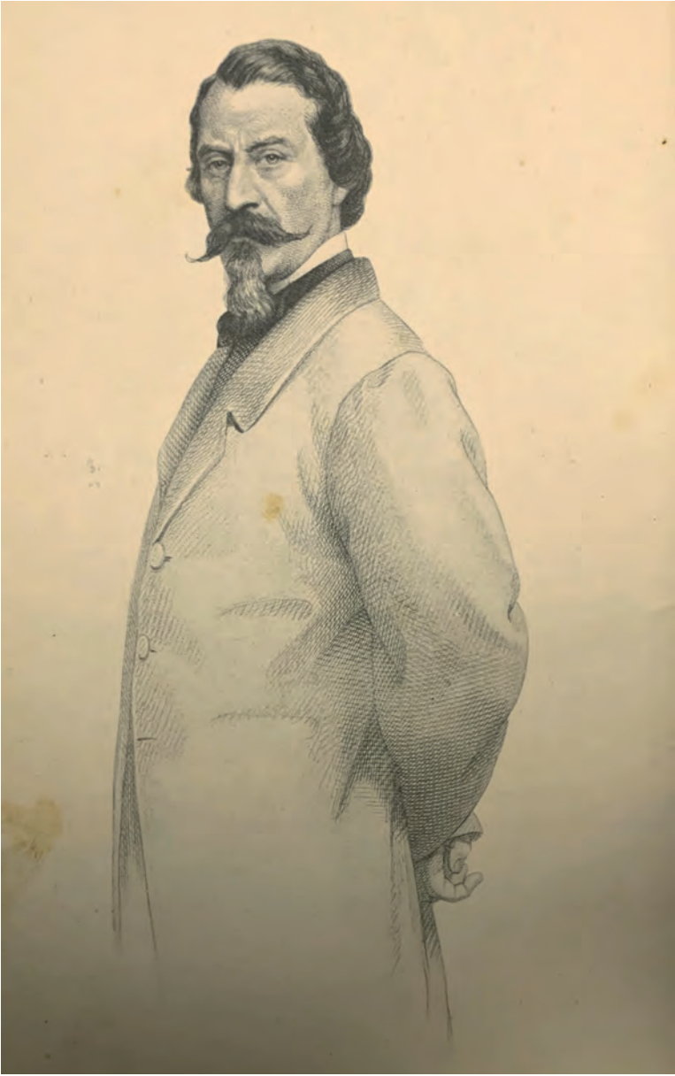
Fig. 5. Ritratto di Aleardo Aleardi , incisione, da Canti di Aleardo Aleardi , edizione stereotipa (nona tiratura), Firenze, G. Barbèra, Editore, 1911, Collezione privata.