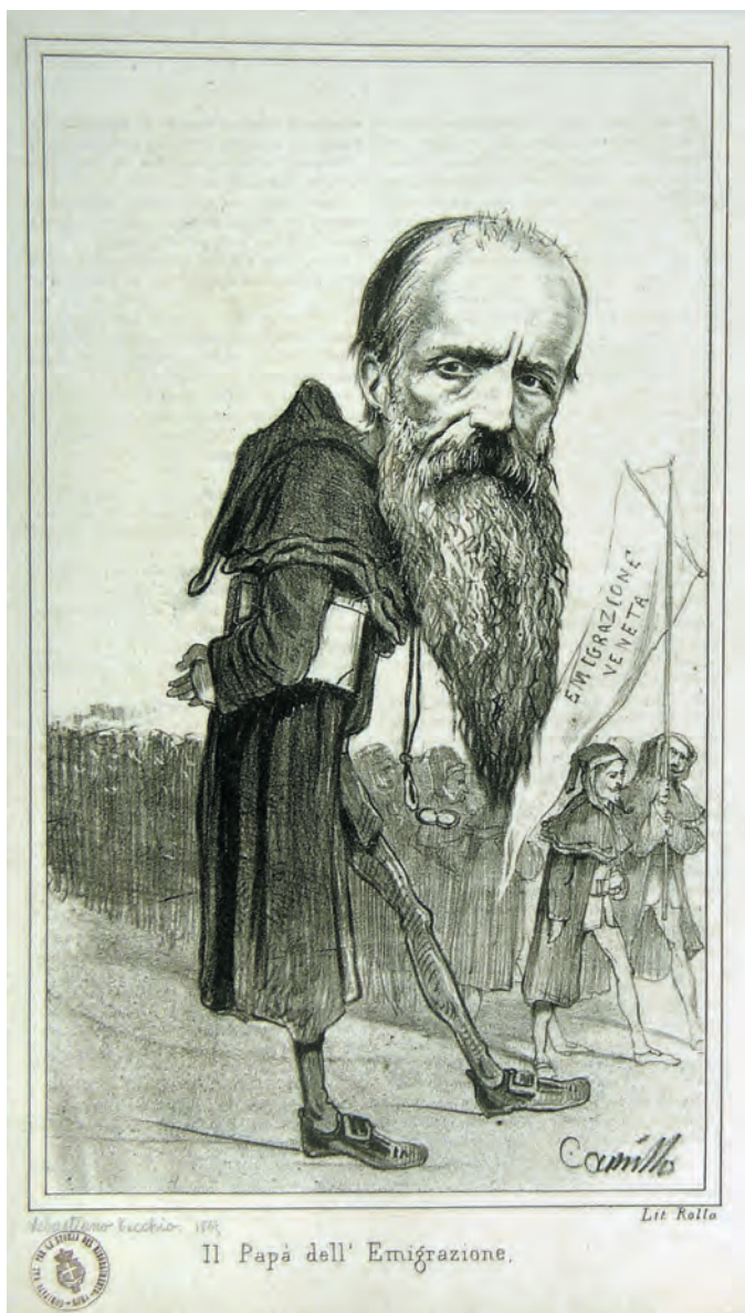
Fig. 7. Camillo Marietti (inventore), Rolla (litografo), Il Papà dell' Emigrazione – Sebastiano Tecchio , su concessione del Museo Centrale del Risorgimento di Roma.