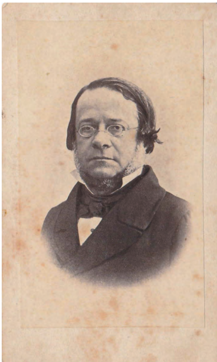
Fig. 11. Ritratto fotografico di Daniele Manin, 1856, Collezione privata.