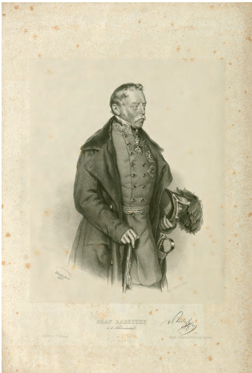
Fig. 1. Josef Kriehuber (litografo), Johann Höfelich (incisore), Graf Radetzky k. k. Feldmarschall. , litografia, 1852, su concessione del Wien Museum, Inv.-Nr. W 5355, CC0.