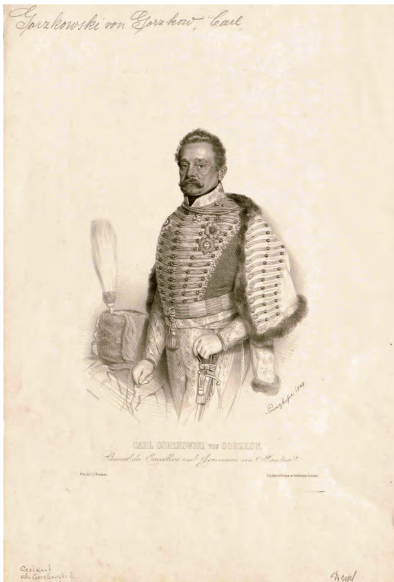
Fig. 2. August Prinzhofer (litografo), Carl Gorzkowski von Gorzkow. General der Cavallerie und Gouverneur von Mantua , litografia, 1849, su concessione della Österreichische Nationalbibliothek in Wien, PORT_00100159_01 POR MAG.