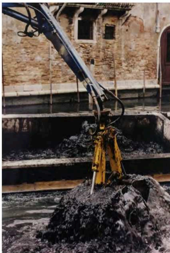
Figg. 7-9. Mark Dion, Raiding Neptune's Vault , 1997. Laboratory / Collection , mobile in rovere contenente materiali espositivi, Mark Dion, Raiding Neptune's Vault , 1997, XLVII Biennale di Venezia, Padiglione Paesi Nordici, cassetto in rovere contenente materiali espositivi, Mark Dion, Raiding Neptune's Vault , 1997, XLVII Biennale di Venezia, Padiglione Paesi Nordici, frammenti di vetro, porcellana, metallo e plastica Archivio Galleria Emi Fontana, Galleria Nazionale d'Arte Moderna, Roma