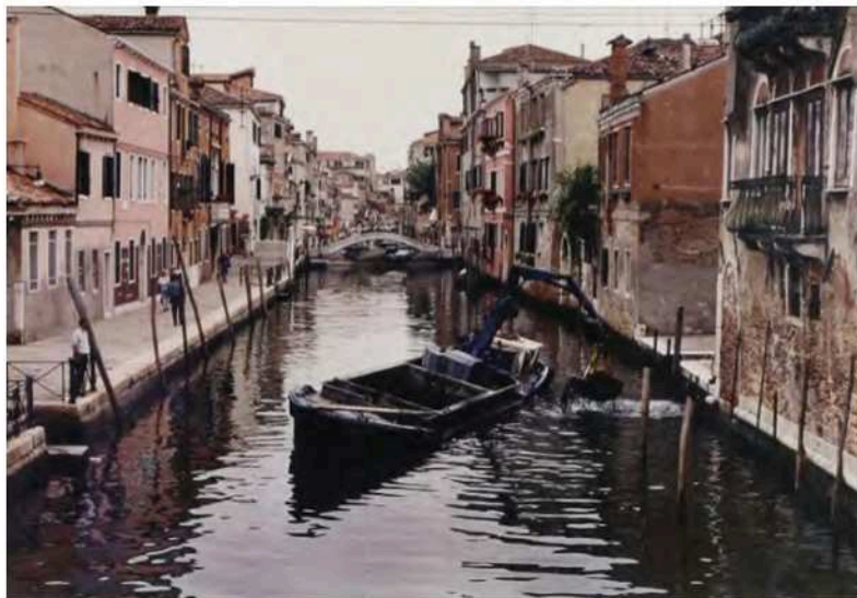
Figg. 5 e 6. Mark Dion, dragaggio del canale di Venezia, Archivio Galleria Emi Fontana, Galleria Nazionale d'Arte Moderna, Roma