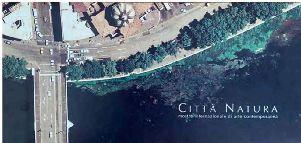
Fig. 10. Invito alla mostra Città Natura , 1997, Archivio Galleria Emi Fontana, Galleria Nazionale d'Arte Moderna, Roma

dotto culturale che interagisce con le dinamiche urbane e ambientali.