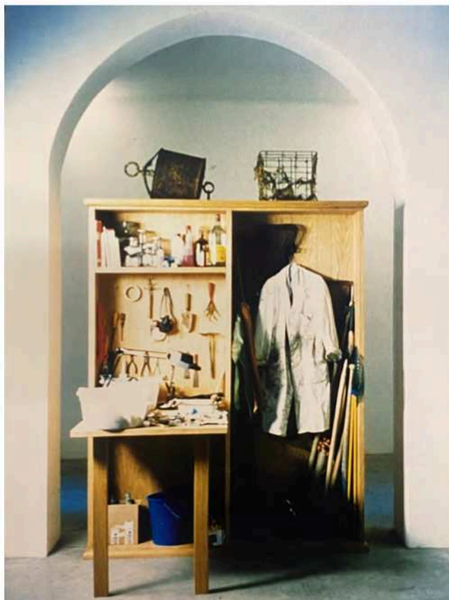
Fig. 11. Veduta della mostra LOOT , 1998, foto di Mario Gorni. Archivio Galleria Emi Fontana, Galleria Nazionale d'Arte Moderna, Roma

Ferrari e Manlio Brusatin presso la galleria Claudia Gian Ferrari Arte Contemporanea di Milano 55 , espressione della crescente centralità delle tematiche ambientali, tanto da entrare anche nelle programmazioni delle gallerie private.