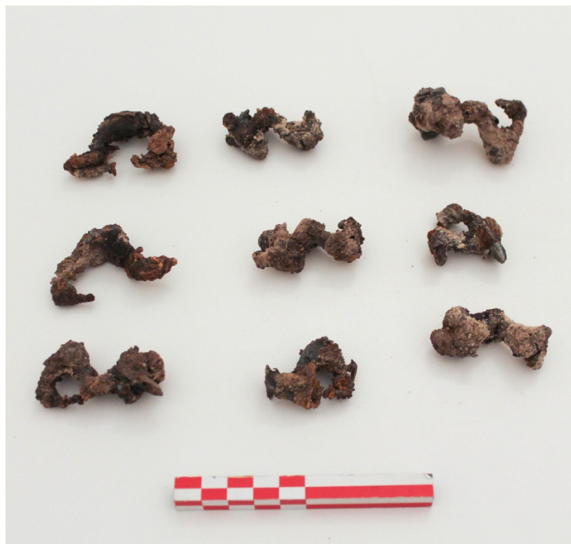
Fig. 6. Le fibule in ferro della tomba 28.