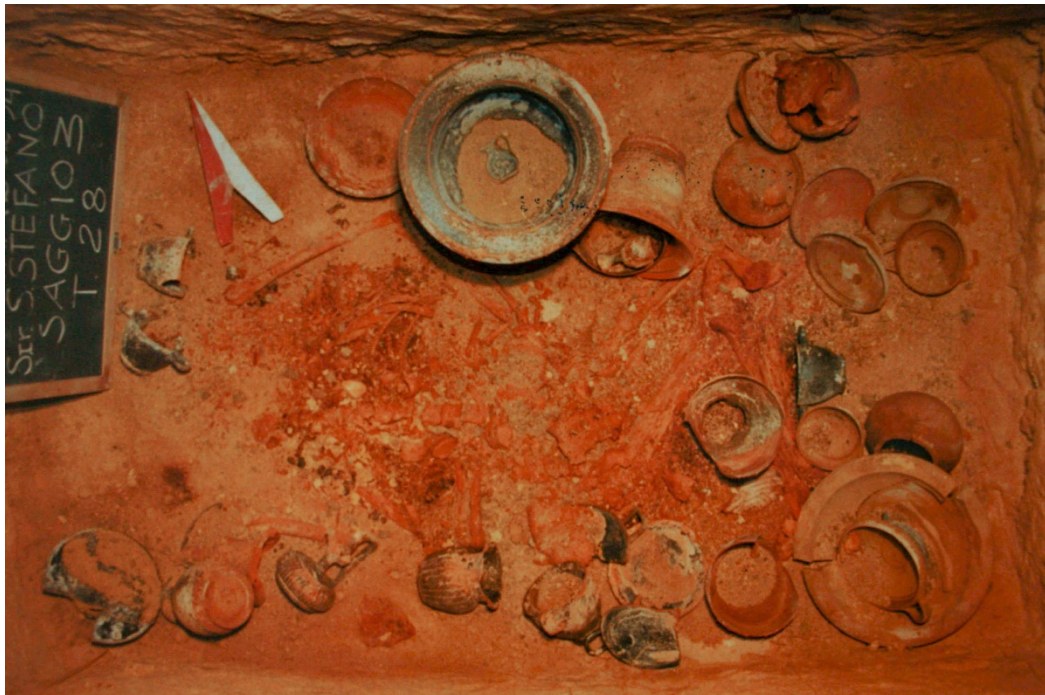
Fig. 2. La tomba al momento del ritrovamento con il corredo e lo scheletro.