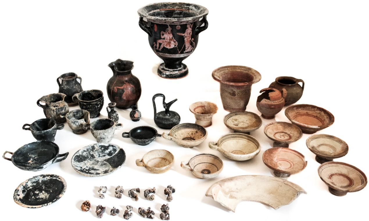
Fig. 1. Il corredo della tomba 28 (foto dell'Autore su gentile concessione SABAP per la città metropolitana di Bari).