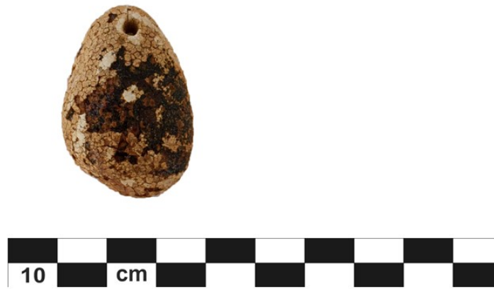
Fig. 5. Il pendaglio in ambra della tomba 28.